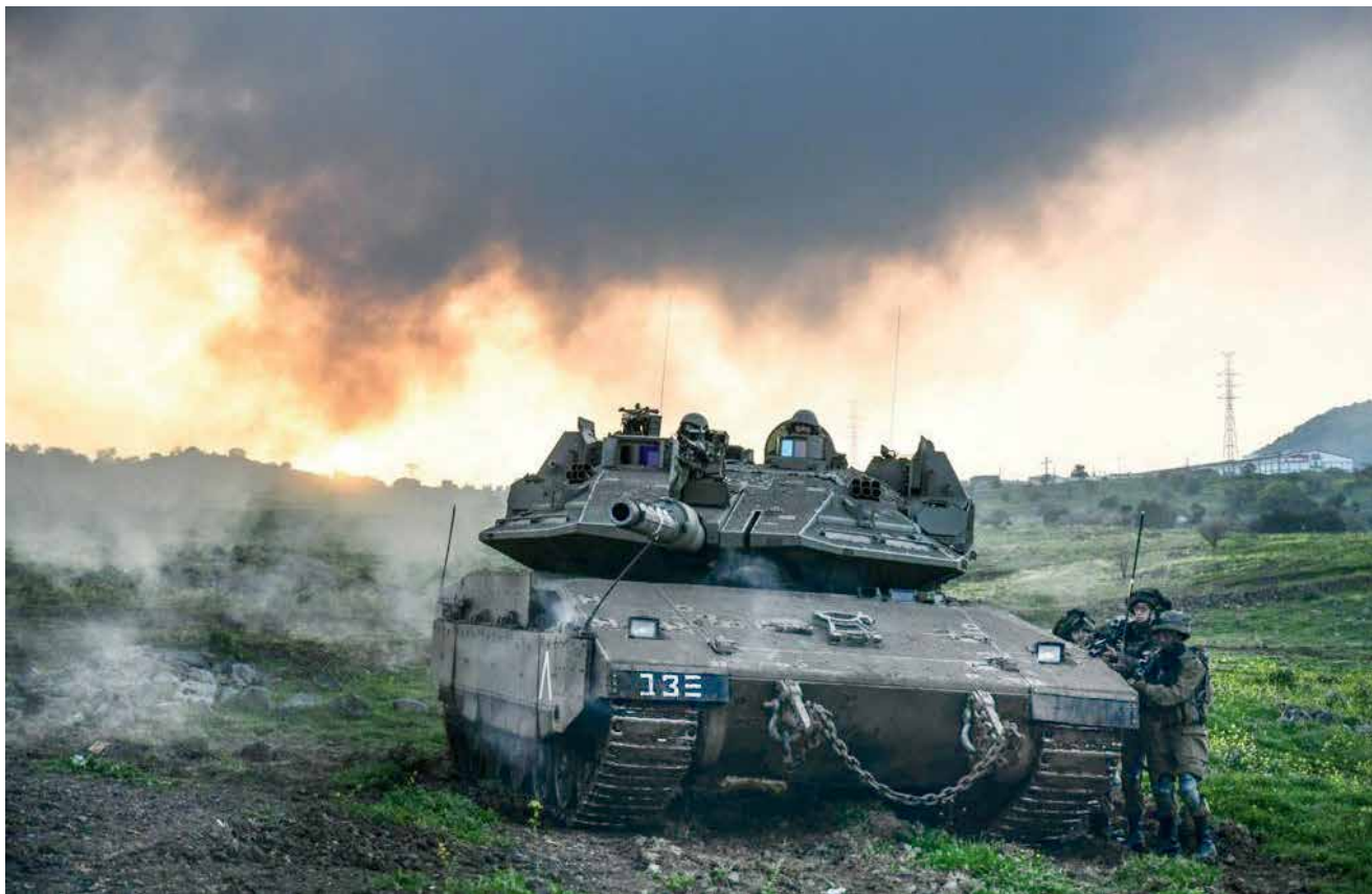
כוח שריון במהלך בוחן רף פצ'ן. בלבנון נידרש הן לאש שטח נרחבת, עוצמתית ומלוות תמרון, והן לאש מדויקת, מקדימה ומלווה, על בסיס מטרות שתוכננו מראש

הקש"א לעבר עמדות חזבאללה בכפר. 9 אין ספק שבלבנון נידרש הן לאש שטח נרחבת, עוצמתית ומלוות תמרון, והן לאש מדויקת, מקדימה ומלווה, על בסיס מטרות שתוכננו מראש. סוגיה נוספת שחיונית ללחימה בלבנון היא סוגיית היוזמה. בספר מתבוסה לניצחון תיאר פילדמרשל ויליאם סליס, שפיקד על קורפוס בורמה בצבא הבריטי בחזית בורמה במלחמת העולם השנייה, כיצד לאחר הנסיגה מבורמה גיבש את הקורפוס שלו שוב ליחידה לוחמת. בתקופת האימונים הזו, שכנה "חישול החרב", ביקש סליס לטפח בלב אנשיו תחושת ביטחון ומסוגלות. 10 סליס שם במהלך האימונים דגש על הצורך "לבצע התקפות באיגוף ולפיתה, ולתקוף את האויב מן האגף ומן העורף, שעה שהאויב מרותק על-ידי לחץ חזיתי". 11 נוסף על כך, ציין, אסור להניח לאויב היפני לנקוט יוזמה, שכן אז הוא במיטבו. מנגד, כאשר היוזמה היא בידי הכוח הבריטי, היפנים "מתבלבלים וקל לקטול בהם", ועל כן "על-ידי ניידות מרוחקת מהדרכים, הפתעה ופעולה התקפית, שומה עלינו לחדש את היוזמה ולהחזיק בה". 12 חשוב לציין, פעילי חזבאללה הלבנוניים אינם שווים ערך ללוחמים היפנים במלחמת העולם השנייה. ואולם הציווי לאחוז ביוזמה בלחימה הוא ציווי עליון. בקרב מידווי במלחמת העולם השנייה (1942) נעו לקראת מפגש שני הציים, היפני בפיקוד אדמירל צ'ואיצ'י נגומו, והאמריקני בפיקוד אדמירל ריימונד ספרואנס. היה ברור שהניצחון יהיה בידי הצי שיחשוף ראשון את כוח האויב, יתקוף אותו וישמידו. מטוסי הקרב של הצי