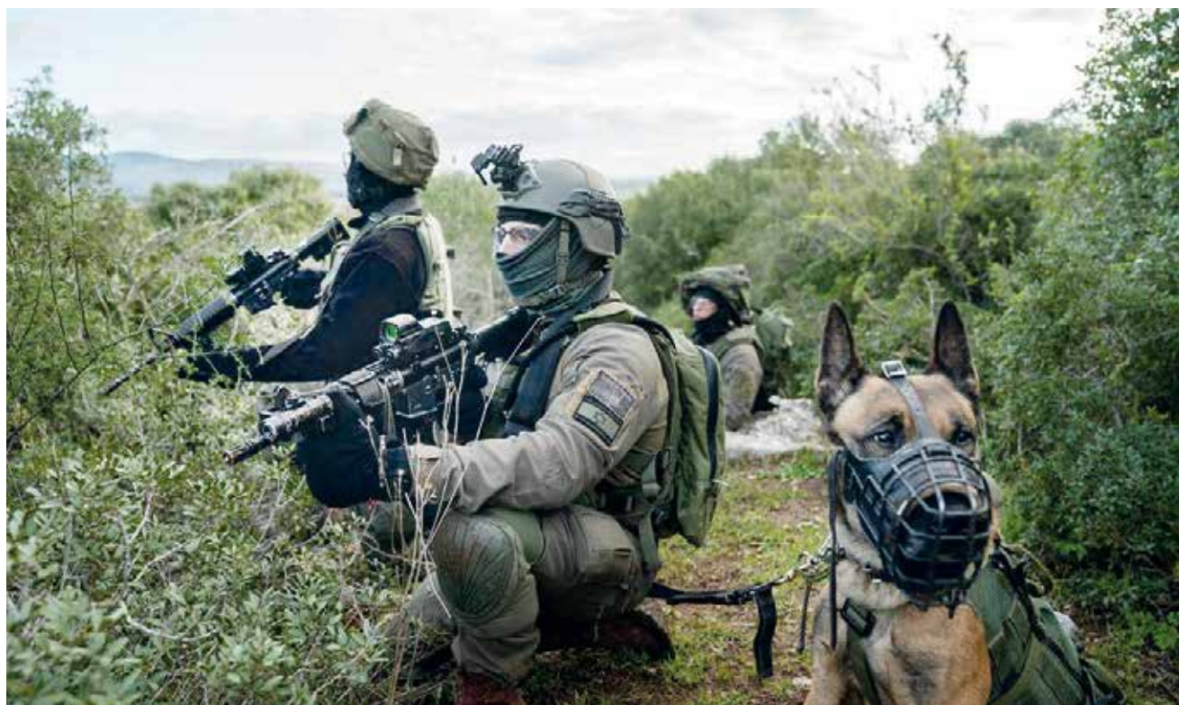
לוחמים במהלך רף פצ"ן, מאי 2020. מן השטח עלה הצורך לערוך מחדש את הטכניקות הקרביות הייעודיות לחזית הצפון ולבחון אותן בתרגול מעשי

אי-הוודאות שבה ייתקלו מפקדים, במיוחד בצבא היבשה, מחייבת אותם להפגין כישורי הסתגלות בביצוע ובהובלת כוחות. זאת בדיוק התפיסה שעמדה בבסיס רף פצ"ן - להטיל את הכוחות לשדה שידמה להם את האתגר המבצעי שיפגשו בלחימה בלבנון, לבחון את כשירותם לעמוד בו ולסגור את הפערים במוכנות עוד לפני המלחמה