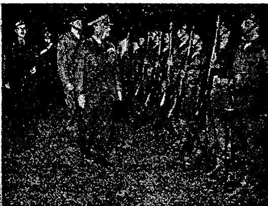
גנרל ברנס הקנדי, מפקד כוח החירום, סוקר יחידת בני קולומביה