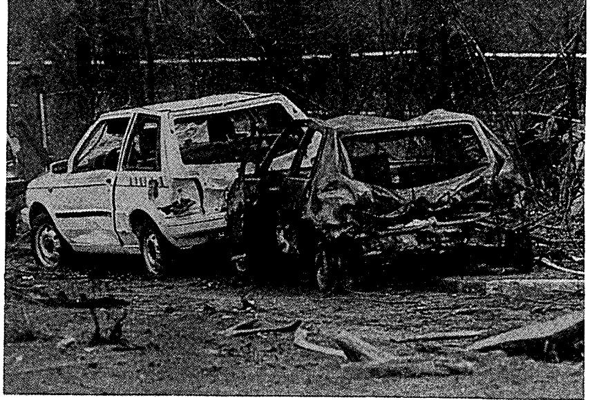
פיגוע טרור בגרמניה פרי ידיה של המחתרת האירית IRA

נראה, כי יש להפריד בין השפעה קצרת-טווח לבין השפעה ארוכת-טווח. לטווח הקצר מעורר הפיגוע רגשות פחד, שנאה וכעס, היוצרים לחץ ציבורי להסלים את המאבק בטרור. אולם, בטווח ארוך, לאחר שזיכרון הפיגוע התעמעם במקצת בתודעת הציבור, משתנות העמדות, ורבים גדלים בציבור דורשים מממשלתם לוותר לטרוריסטים, ולפייס את דעתם, כדי למנוע פיגועים בעתיד.