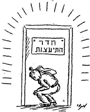
„חדר ההתייעצות „קודש קודשים“ הוא“

של ביה"ד. תקנה 154 של חוקת השיפוט אומרת: — „רק השופטים משתתפים בהתייעצות בית-הדין ואין לגלות את הנעשה בה. פרט להחלטות של-פרסום.“