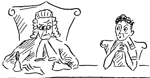
היחסים בין השופטים המקצועיים והבלתי מקצועיים...

בהתאם לחוקי הראיות, הקיימים במדינה, חייבים הצדדים במשפט להוכיח לפני ביה"ד את כל העובדות שיש להן חשיבות לשם הכרעה בדיון. כלל זה חל גם כשעובדה מסוימת ידועה לשופט בדרך מקרה, לדוגמה: —