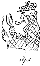
„שופט שלא יהפך לבלש...“

יתכונן כיצד? קודם כל חייב השופט לשלוט שליטה מלאה בכל החומר העובדתי שהובא בפני ביה"ד, באמצעות עדויות שהושמעו ומסמכים (או מוצגים אחרים) שהוגשו ונתקבלו על-ידו. בשום פנים ואופן אין לסמוך בענין זה על הזכרון בלבד.