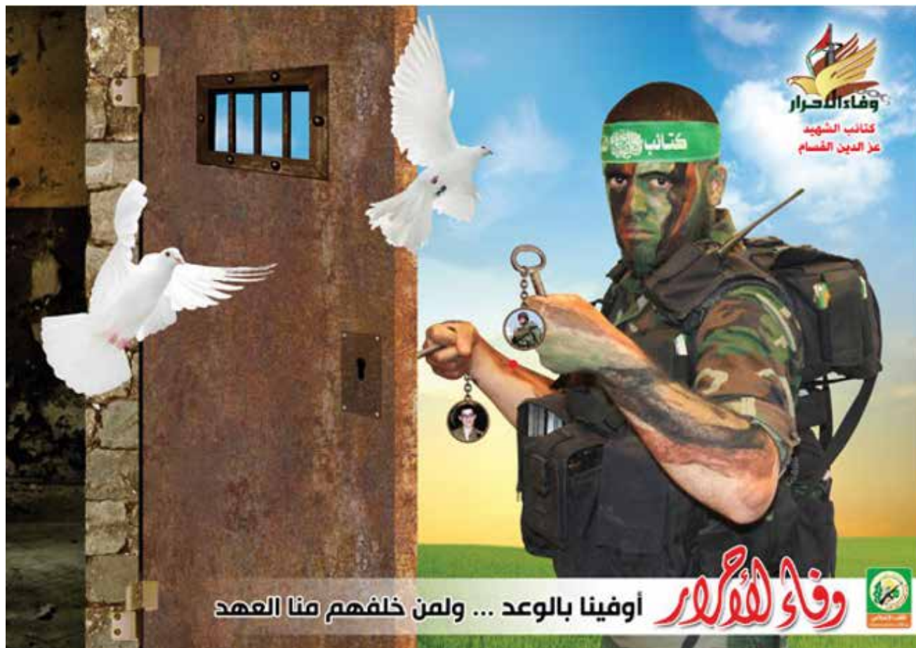
כרוז מיום השנה לעסקת שליט ב־2022. "נאמנות לבני החורין. נאמנים להבטחה ולמי שנשאר מאחור [בכלא] מאיתנו ההבטחה [לשחרור]".

קרצ'אוי ובו קבע: "...כל ישראלי הוא חייל בצבא או בפועל או בכוח, דהיינו הוא חייל מילואים שניתן לזמנו בכל עת למלחמה. אלה אשר מכונים (אזרחים; מְדִנְיִין) הם לאמיתו של דבר אנשי צבא בצבא בני ציון בפועל או בכוח" 5 . קרצ'אוי קבע כי ההתנגדות (מְקַאנְמָה) לכובש הפולש לאדמת פלסטין היא לגיטימית הן בחוק השמימי, החוק העשוי בידי אדם והאמנה הבין־לאומית. הוא פסק כי חלק מהתנגדות זאת היא הפגזת ההתנחלויות של ישראל או המתנחלים ולקיחה בשבי של קצינים וחיילים, או חטיפתם והחזקתם בתמורה לשחרור אסירים ושבויים מקרב הפלסטינים, או בתמורה לפינוי המולדת על ידי הכיבוש וצבאותיו. 6 באופן דומה פסק אבו מחמד אל־מקדסי הירדני, תיאורטיקן חשוב של אל־קאעדה, בפסק ההלכה שבו הצדיק מבחינה הלכתית את פיגועי 11 בספטמבר. הוא פסק כי ילד בהלכה המוסלמית נחשב בוגר (בְּאַלְע') מרגע שנראו בו סמלי בגרות מינית, כלומר קרי לילה או צמיחת שערות סביב איבר המין. הדבר יכול להיות בגיל 12 או אף צעיר יותר, ומאז הוא נחשב בשריעה בוגר ומחויב בקיום מצוות. מכאן הסיק כי מגיל זה ואילך לא ייחשב עוד גם הלא מוסלמי כילד אלא כבוגר, ולפיכך לא יחול לגביו האיסור הקיים באסלאם להרוג ילדים, דהיינו דמו יהיה מותר. 7 טיעון נוסף שהעלה מקדסי הוא כי נשים,