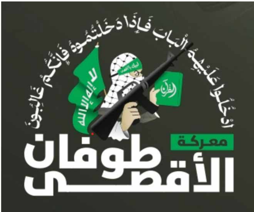
סמליל מערכת "מבול אל-אקצא". "היכנסו עליהם בשער, וכאשר תיכנסו בו תהיו הגוברים" (מתוך סורת אל-מא'א'דה).

את ציר ההתנגדות מובילה איראן השיעית, וכדי לאחד את הכוחות סביב אויב משותף עמעמו ההבדלים בין הסנה לשיעה ואומצה גישת "קירוב" (תְקָרִיב אל-מַדְאִהָב) ביניהן. בנאומו