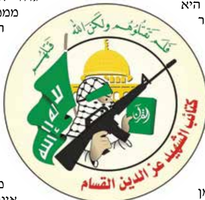
סמליל גדודי אלקסאם

ניצחון מבחינתה איננו מונח צבאי אלא תודעתי ותרבותי אסלאמי. ככל שתעמוד זמן רב יותר בפני ישראל בלחימה ולא תיכנע - הרי שהיא מגלה אורך רוח שהוא תכונת המאמינים. תבוסה (הזימה) בעיני חמאס אף היא איננה מונח צבאי אלא תרבותי אמוני. מבחינתה, מכיוון שאללה עומד לצידם הם אינם יכולים להיות מובסים. על כן המטרה צריכה להיות לא רק לפגוע בחומר, אלא לנסות ולפגוע ברוח הלחימה של חמאס באמצעות הבנת רכיבי תרבות ההתנגדות שלה. חשוב גם לזכור כי חמאס מגלמת רעיון אסלאמי אמוני, ואותו קשה יותר למגר.