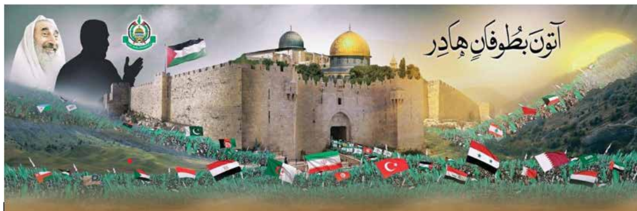
משמאל: שיח' יאסין ומימין צלילת של מחמד אל-צי'ף. "עמנו הפלסטיני ואומתנו הערבית והמוסלמית באים לשחרר את ירושלים ואת המקומות הקדושים כמבול הומה [...]". מקור: חמאס

חמאס היא תנועה אסלאמית הניחנת באורך רוח, מתוך אמונה שאללה הכריע את המאבק בפלסטין לטובת המוסלמים ולכן זו רק שאלה של זמן עד שישראל תחדל להתקיים. ניצחון מבחינתה איננו מונח צבאי אלא תודעתי ותרבותי אסלאמי. על כן המטרה צריכה להיות לא רק לפגוע בחומר, אלא לנסות ולפגוע ברוח הלחימה של חמאס באמצעות הבנת רכיבי תרבות ההתנגדות שלה