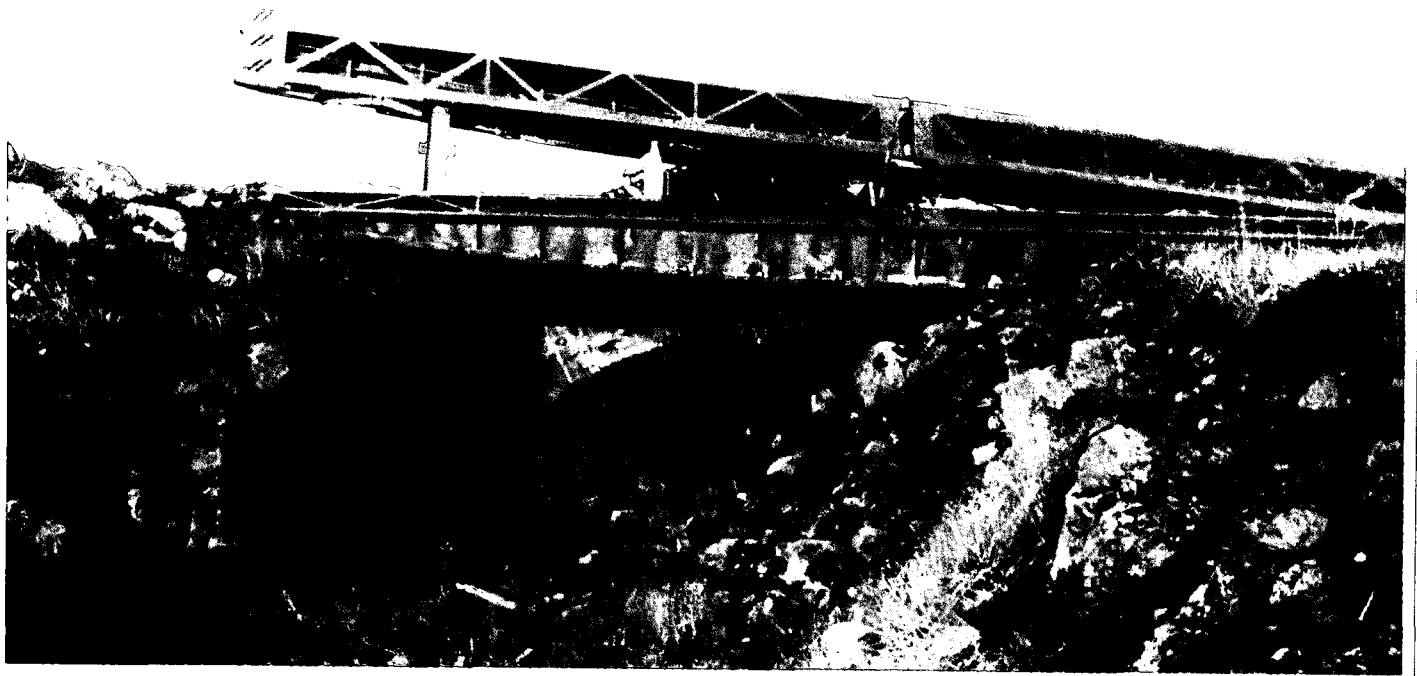
טג' ש מודי בתעלת הנ"ט ברמת הגולן

ככיתי. בכי ארוך ומתמשך. בכיתי, משיל מעלי כבגד מלוכלך את כל המתח והלחץ והפחד, קולות הירי והנפץ ומראות הטנקים הבורעים. המשכתי לבכות כשחשבתי על הורים אחרים המצפים