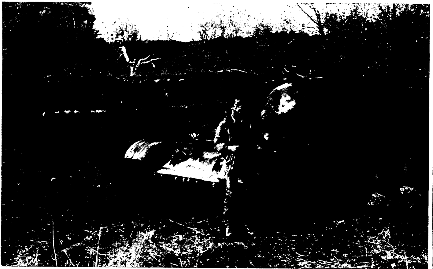
המחבר על-יד הטנק הפגוע בסיפור אין ירי

לאורך כל קו רמת-הגולן היתה חפורה תעלה עמוקה ורחבה, שהיוותה מכשול עיקרי נגד טנקי האויב. משימתם הראשונה של