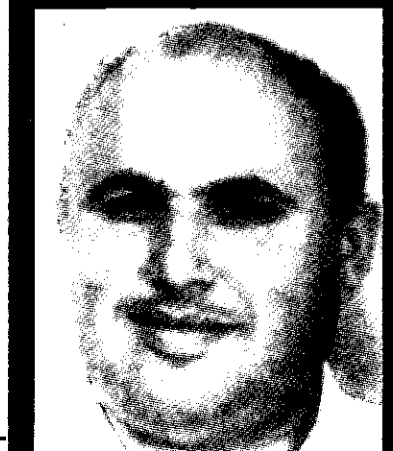
חוקר במטה ללוחמה בטרור

ניתן לקבוע שמדיניות הפיגועים של החמאס היא פונקציה של אילוצים, של תכתיבים ושל פשרה פנים-ארגונית. הפשרה היא בעיקר בין גורמי הפנים לגורמי החוץ בתנועה