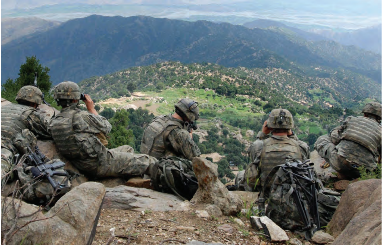
נחות אמריקניים מתצפתים במחוז קונאר, 2006. המבצע בשאח־אייקוט נכשל בעיקר בשל סטייה קשה מעקרונות התמרון

חשוב ומה לא. הידע על האויב והכנתו אינו מצוי בספרי ההדרכה, ולא במסרי נתונים המוכנים מראש. הידע המודיעיני הוא תוצר של אדם. 4 הניסיון של האמריקנים להילחם באל־קאעדה בכוחות משולבים ב־2–13 במרס בעמק שאח־אייקוט נכשל. המבצע בשאח־אייקוט נכשל לא בשל יכולתם המבצעית הנמוכה של הלוחמים והמפקדים, אלא בעיקר בשל סטייה קשה מעקרונות התמרון: