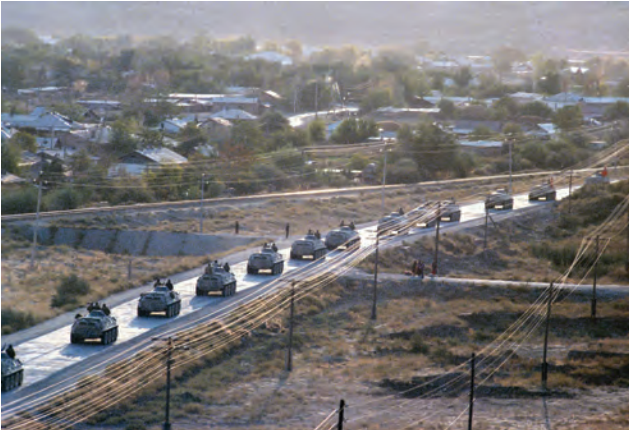
טור נגמ"שי BTR סובייטיים בדרך לאפגניסטאן, 1986. הסתגלותם של המג'אהדין לתנאי הלחימה החדשים הייתה קשה, אך הם הצליחו בכך