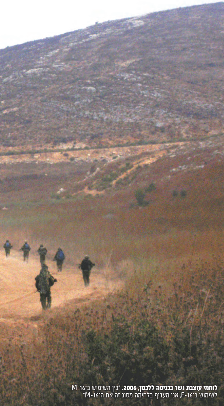
לוחמי עוצבת נשר בכניסה ללבנון, 2006. בין השימוש ב-M-16 לשימוש ב-F-16, אני מעדיף בלחימה מסוג זה את ה-M-16

באמצע שנות ה-80 של המאה ה-20, בעיצומה של לחימת הסובייטים באפגניסטאן, שאל עצמו ההוגה הבריטי בריגדיר ריצ'רד סימפקיין את השאלה: מדוע כוחות מהפכניים מנצחים צבאות סדירים? סימפקיין הגדיר את שתי הצורות החשובות ביותר של המלחמה היבשתית המודרנית: מלחמת התמרון והמלחמה המהפכנית. במלחמה של ישראל נגד חזבאללה ביבשה באו שתיהן לידי ביטוי. כך גם במלחמה באפגניסטאן שהתרחשה בשנות ה-80 בזמן שסימפקיין כתב את ספרו, 2