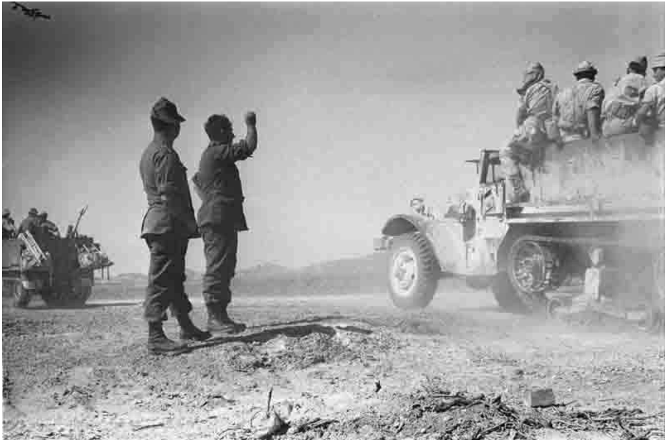
צנחנים בציר כונתילה - מתלה, 1956. ניתן להכריע את האויב תוך שימת דגש על שלילת יכולותיו - גישת שחיקה - וניתן לעשות זאת תוך מתן דגש על שלילת רצונו - גישת תמרון