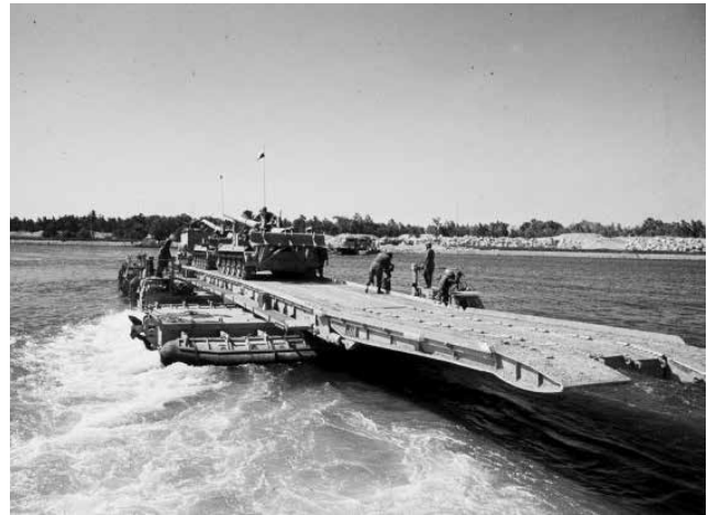
תוחמים בתנועה, 1973. למיצוי התמרון הטקטי נדרשת גישת פו"ש המבוססת על "פיקוד משימה"

אסטרטגיית זה"ל העדכנית מינואר 2018 מתווה שתי גישות ברמה האסטרטגית: גישת המניעה וההשפעה וגישת ההכרעה. גישות אלה מקיימות קשר הדוק עם רעיונות היסוד של הביטחון הלאומי, ומחזירות ללב הבמה את הצורך לסיים כל עימות בהכרעה צבאית מהירה (ההתייחסות היא לעימותים בעצימות בינונית או גבוהה.