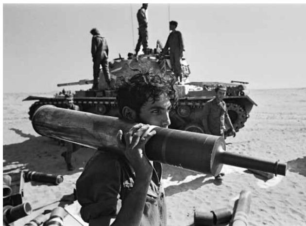
חימוש טנקים, 1973. אסטרטגיית צה"ל העדכנית מינואר 2018 מתווה שתי גישות ברמה האסטרטגית: גישת המניעה וההשפעה וגישת ההכרעה

מערכת ההקשרים המורכבת שבין תיאוריה ומעשה, בין עבר, הווה ועתיד, ובין בניין הכוח להפעלתו, מחייבת את המנהיגות ואת הכוחות הצבאיים לבחון ולפרש מחדש את מערכת המושגים המשמשת אותם. בחינה של מלחמות העבר תוכיח כי מעולם לא הייתה מלחמה קלאסית, ואף לא תמרון קלאסי. מלחמות והאמצעים המשמשים בהן מעוצבים בידי התנאים והנסיבות השוררים. ככל שאלה משתנים, מתאימה המלחמה את פניה, את צורותיה ואת דרכיה לנסיבות הזמן. צה"ל, שהתרחק בעשורים האחרונים מן העקרונות ומן היסודות שהיוו את ליבה של המחשבה הצבאית הישראלית, נדרש לשוב ליסודות הדוקטרינריים, שבמרכזם התמרון וההכרעה. המרכזיות והחינוכיות של התמרון וההכרעה בלב המחשבה עליה מבוססת אסטרטגיית צה"ל, תובעות לתקף ולפרש מחדש את המושגים הללו בבסיס לשפה משותפת, הנדרשת לצורך בניית והפעלת היכולות, בהתאמה למאפייני הסביבה ולהתפתחותו של שדה הקרב העתידי. ההערות למאמר זה מופיעות בסוף הגיליון.