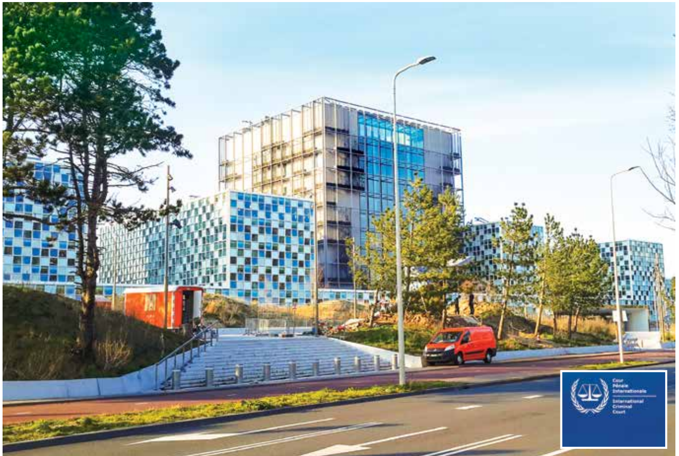
בית הדין הפלילי הבינלאומי בהאג. יש חשיבות לפעול כבר כעת להמחשת מחויבותה של ישראל לפעול בהתאם להוראות דיני המלחמה, על אף האתגרים שמציאות זו צפויה לעורר בהקשרים הנוגעים ליישום הכללים.

ללוחמת סב"ר, לפעילות צבאית בחלל ולשימוש בטכנולוגיות חדשות כמו כלי נשק אוטונומיים ובינה מלאכותית. מלחמת רוסיה-אוקראינה צפויה להיות זרו לתהליכים בזירה הבינלאומית, במסגרתם נעשים כבר כיום ניסיונות לפרש את הוראות דיני המלחמה באופן המשנה את נקודת האיזון בין האינטרס של המדינות לשמר את חופש הפעולה המבצעי שלהן ובין הרצון לשפר את ההגנה הניתנת לאזרחים מפני תוצאותיה של הלחימה. לישראל, מדינה הנמצאת בחזית הלחימה ומתמודדת עם אתגרים מורכבים (פעמים רבות לראשונה בעולם), בהקשרים לעיתים ייחודיים, 30 יש ניסיון ייחודי בפירוש כללי הדין הבינלאומי ובהתאמתם למציאות המורכבת, שחשוב לשתף בו אחרים. 31 כפועל יוצא, היכולת שלנו להשפיע על השיח הבינלאומי בתחום רבה. 32 האתגרים הצפויים ללחימה בעתיד כפועל יוצא מהתפתחויות אלה מהותיים יותר לישראל מאשר לרוב מדינות העולם המערבי (בפרט בהיבטים הנוגעים ללחימה אורבנית נגד ארגוני טרור הפועלים מקרב האוכלוסייה האזרחית), ועל כן יש לנו אינטרס מובהק לקדם שיח מקצועי בעניין עם מומחים ומדינות שונות כדי להשפיע על ההתפתחויות בתחום. אחד האתגרים המרכזיים בהקשר זה נעוץ במתח שבין הרצון לקדם יוזמות שיחזקו את ההגנה הניתנת לאזרחים במלחמה (כחלק ממדינות העולם המערבי ובתגובה לאופן שבו מתנהלת הלחימה