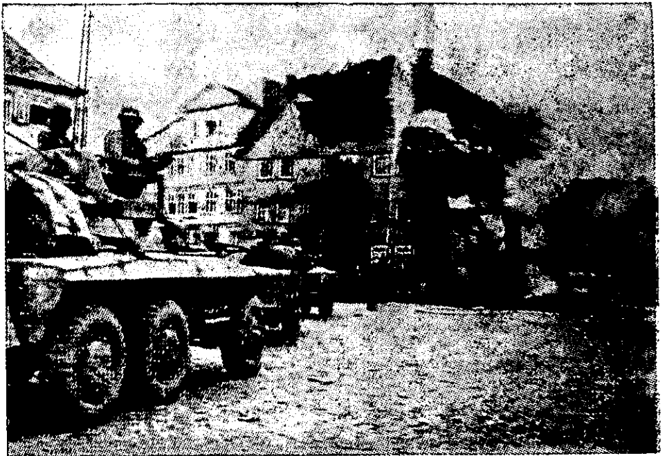
האמריקאים מלוים קצינים גרמניים שבויים דרך בורגזין

כשהתקרב הטנק המוביל אל הגשר, ושני רובאים כבר החלו חוצים אותו בריצה, הפעילו הגרמנים מטעני חבלה שהוכנו מראש ופוצצו את הגשר. "הגרמנים העיפו לנו את הגשר בפרצוף", נזכר באום מאוחר יותר.