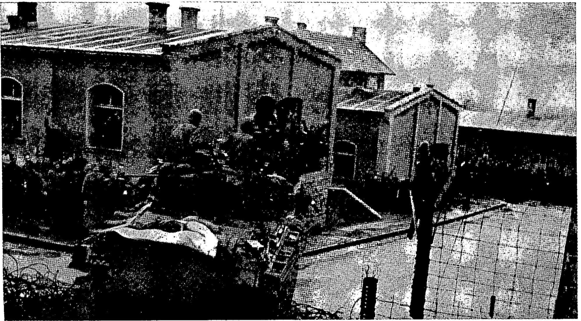
שיחרורו הסופי של מחנה השבויים בהמבורג

כל זה הושג על-ידי כוח קטן יחסית ובמחיר נמוך יחסית. לפי דוח האבדות הסופי, נפצעו 32 איש ותשעה נהרגו (מספר זה איננו כולל את אלה שלא הודיעו על פציעות קלות, וכן לא כולל את ההרוגים והפצועים מקרב שבויי-המלבורג שבחרו בחופש). בסופו של דבר התברר, מה עלה בגורלם של רוב אנשי כוח-המשימה. אחדים חזרו אחרי שיחרורה הסופי של המלבורג, אחרים — אחרי המלחמה. ששה-עשר נעדרים עד היום.