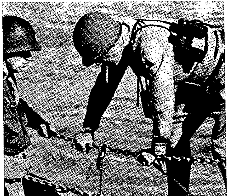
גנרל פאטון (מימין) ומיוזר סטילר

לא ברור אם הטענה שכנעה את באום, או שחשב שסטילר יצא מדעתו. על כל פנים — הוא הזמין אותו לנסוע עמו בג'יפ הפיקוד. לאחר מכן הסביר באום, שלסטילר לא היה כל תפקיד בפעולה — הוא רק לקח חלק בכל הסכנות האישיות, שכל אחד מן החיילים עמד בפניהן.