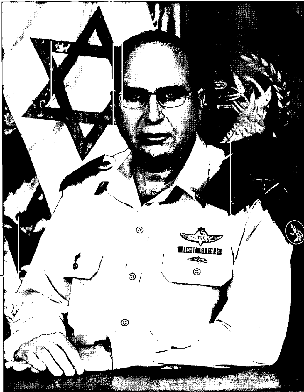
רב-אלוף משה (בוגי) יעלון

אין ספק כי הלמידה וההתפתחות בתחום הפעלת הכוח של צה"ל ובניין בלחימה בארבע השנים וחצי האחרונות הן בסיס איתן להמשך פיתוח ידע ותורה לצה"ל ולצבאות כל העולם. יכולת צה"ל שפותחו והבשילו לכדי יכולות מבצעיות מרשימות ישמשו אותנו לעתיד לבוא. התקופה הקרובה תהיה תקופת מבחן לעוצמה של מדינת ישראל ושל צה"ל