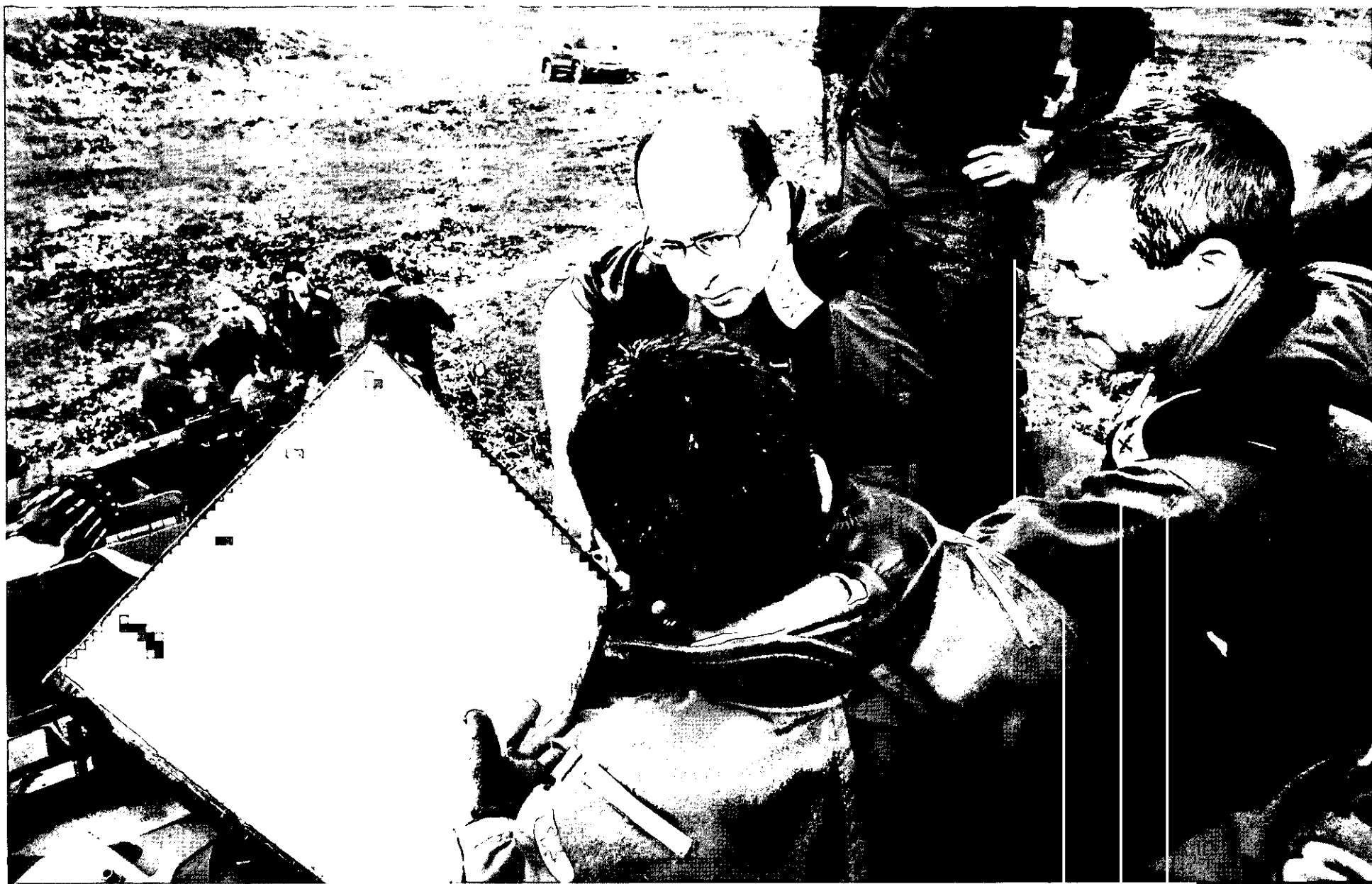
הרמטכ"ל במהלך תרגיל בצפון

ההכרעה במאבק שבו אנו נמצאים אינה באה לידי ביטוי בשלילת יכולת האויב באופן מוחלט. במלחמה הזאת הצד המכריע הוא זה שברצף ניצחויות מביא את הצד השני להבנה כי האלימות והטרור אינם משתלמים