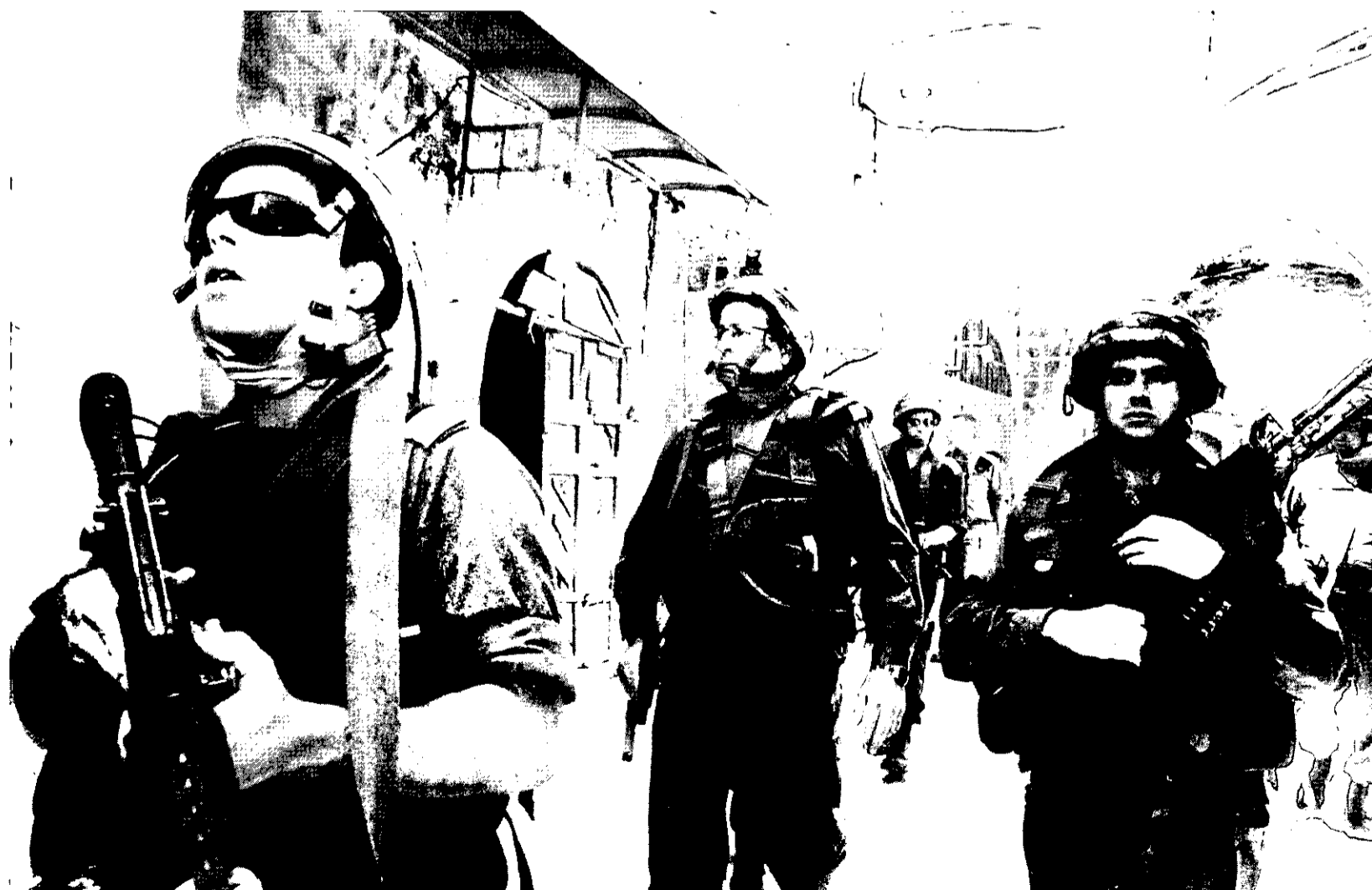
הרמטכ"ל עם כוחות צה"ל באיו"ש

האתגרים הניצבים בפנינו בימים אלה ממש מחייבים אותנו לא רק ללמוד את לקחינו מתחום הפעלת הכוח במלחמה שהייתה, אלא לנסות ולשער מה יהיה טבעו של הסיבוב הבא בעימות, סיבוב אלים שכולנו מייחלים כי לא יקרה - אך אנו כצבא חייבים להתכונן אליו