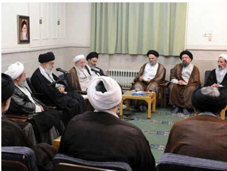
בכירי חכמי הדת באיראן במפגש בקום עם המנהיג העליון חמינאי (משמאל, בטורבאן שחור), נובמבר 2010 | המתח בין השאיפה של שלטון חכמי הדת בטהראן לקדם אידיאולוגיה מהפכנית לבין הצורך לשמור על האינטרסים של המשטר מאפיין את איראן מאז תום המהפכה האסלאמית ב-1979.

מרכזיים שמהם ניתן ללמוד עד כמה ניתן יהיה להרתיע איראן גרעינית: