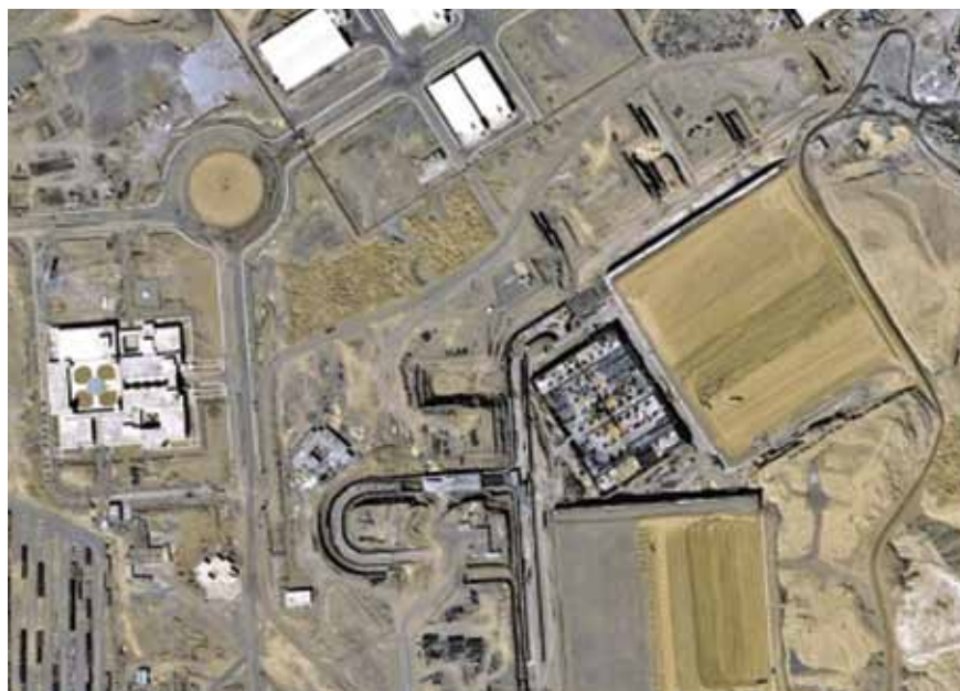
מתקן הגרעין האיראני בפראצ'ין | הסיכויים לציבות אזורית מתערערים נוכח איומיהן של יריבותיה של איראן באזור, ובראשן סעודיה, להחזיק בנשק גרעיני אם המשטר בטהראן יחזיק בנשק כזה

הסתרת זהותם ואת הישרדותם. יש חוקרים שטוענים שהציוויים הדתיים האלה מסבירים את ההתנהלות החשאית ואת צעדי ההונאה של איראן בכל הנוגע לתוכנית הגרעין הצבאית שלה.