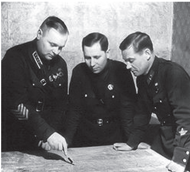
גנרל מרצקוב, מפקד פיקוד לנינגרד (משמאל), עם קציני מטהו מרצקוב הכין את התשתיות לקראת המלחמה. בין היתר הוא שיפר והרחיב את מסילת הברזל לנינגרד-מורמנסק וכביש נלווה