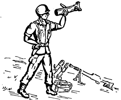
נחרדתי לראות את מצב הנשק

אותן כחלק מן השעור, הזכרנו אותן בסיכומי תר-גילים, הם היו אצלנו בבחינת תגובה מותנית, בבחינת שגרה. יתכן ועשינו זאת מתוך משמעת, משום שכך צריך לעשות. בשעת השעורים שלחתי חוליה לתצ-פית, פקדתי על תצפית הקפית וכד' — ובזאת הסתי-פקתי. אבל בתנאי עייפות ובעיקר כאשר נתתי לעיי-פות להתגבר עלי, התצפית כמעט ולא קוימה. במקום שתהיה טבועה בדמם של אנשי, היתה התצפית במח-לקתי כ"מצות אנשים מלומדה". כאשר שיחקתי