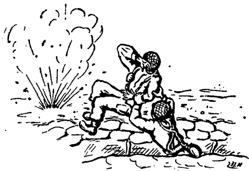
במקום שעליו עמדתי התפוצץ פגז מרגמה

בריאות. מצאתי שזה ענין של מוראל. חייל נקי ומצוחצח — נשקו, אף הוא נקי. אשר ל"פיטר", נתברר לי כל לא החבר'מן הוא ה"פיטר"; ה"פיטר" הוא החייל הערום והפעיל המפתיע את האויב בכל