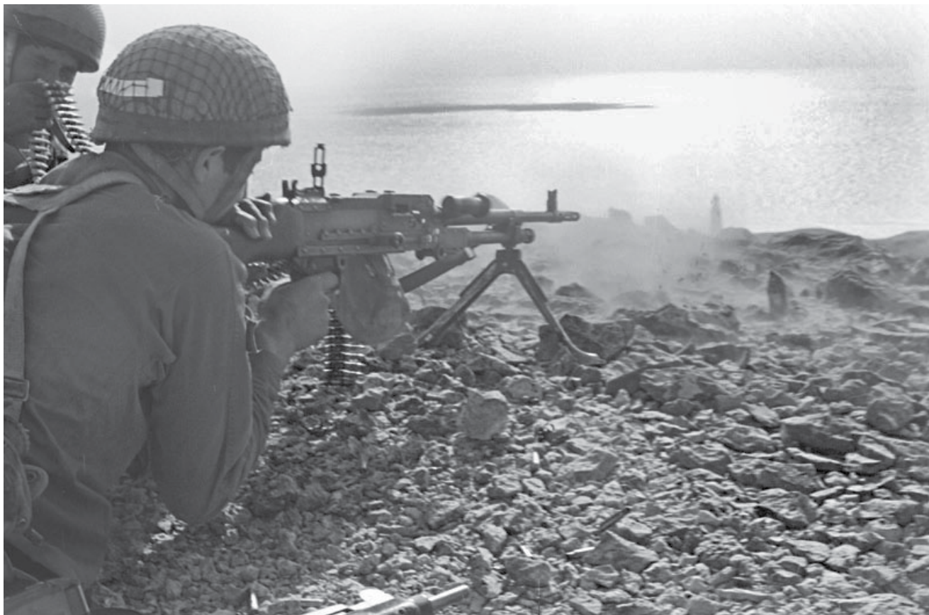
ירי רתק בזמן הסתערות הצנחנים על האי שדואן, במבצע "רודוס", 1970. כיבוש היעד "בתייה" (מתחם המגדלור שעל האי) היה אמור להיות גולת הכותרת של המבצע.