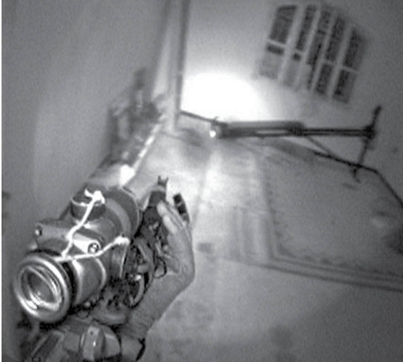
לוחמים במהלך מבצע "חד וחלק", אוגוסט 2006. כשעלה הרעיון לפשוט על יעדי חזבאללה בעיירה בעלבכ, לא נמצא אלוף שראה בפיקוד על המבצע את אחריותו הברורה.

לפעולה בעומק, שיש גם בהם כדי לשדר חוסר כוונה למימוש התוכניות". 12 לאלה מתווספת נטיית המטכ"ל לפו"ש ריכוזיים על חשבון הפיקודים המרחביים, באופן שמחליש ומעקר את עצמאותם, ובפועל, את תחושת המסוגלות והיכולת של כוחות היבשה, ובהם הכוחות הפועלים בעומק. 13 מערכות השו"ב המתקדמות חיזקו מגמה זו, שכן הקנו שליטה רבה יותר לפיקוד הבכיר שבמפקדות, ופגעו בצורה קשה ביוזמה ובחופש הפעולה של דרג מפקדי השדה.