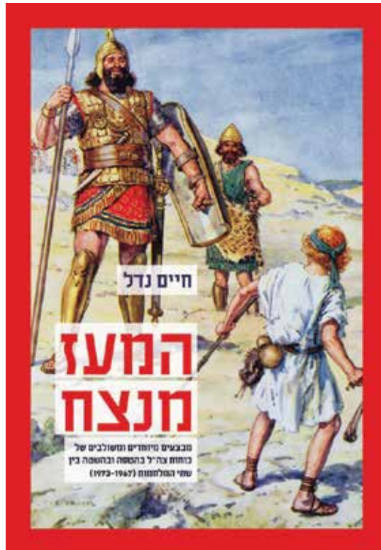
נדל, ח' (2015). המעז מנצח. מערכות ומודן

ויקטוריה" ביוני 1970), סיירת חרוב בירדן, סיירת אגוז ב"פתחלנד" שבלבנון, לא נכללו מסיבה זו, וכלל זה חל גם על הפשיטות הרגליות והרכובות שביצעו גדודי גולני והצנחנים. המיקוד היה בתכנון ובביצוע רב-חילי ורב-זרועי.