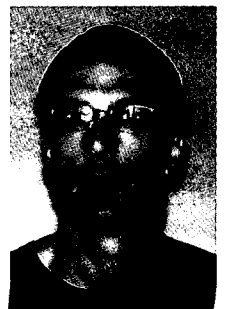
קצין חי"ר וצנחנים ראשי