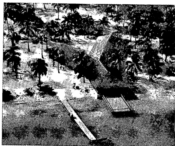
מועדון החגרים בסגנון מקומי