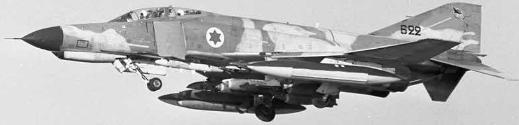
מטוס פנטום בשירות חיל האוויר. ב־18 יולי 1970 נערך חיל האוויר למבצע נוסף להשמדת מערך הטילים בין אסמאעיליה לתעלת סואץ, במה שכונה מבצע "אתגר".