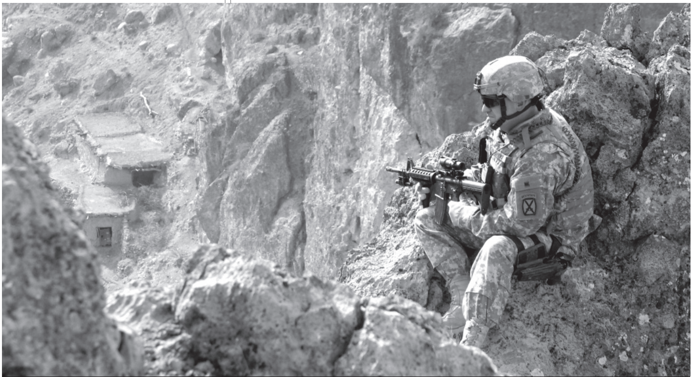
צבא ארה"ב באפגניסטן | בעוד המערב חותר למלחמה טכנולוגית נקייה, חותרים ארגוני הג'יהאד ליצור סביבת לחימה המנטרלת את היתרון הטכנולוגי שלו