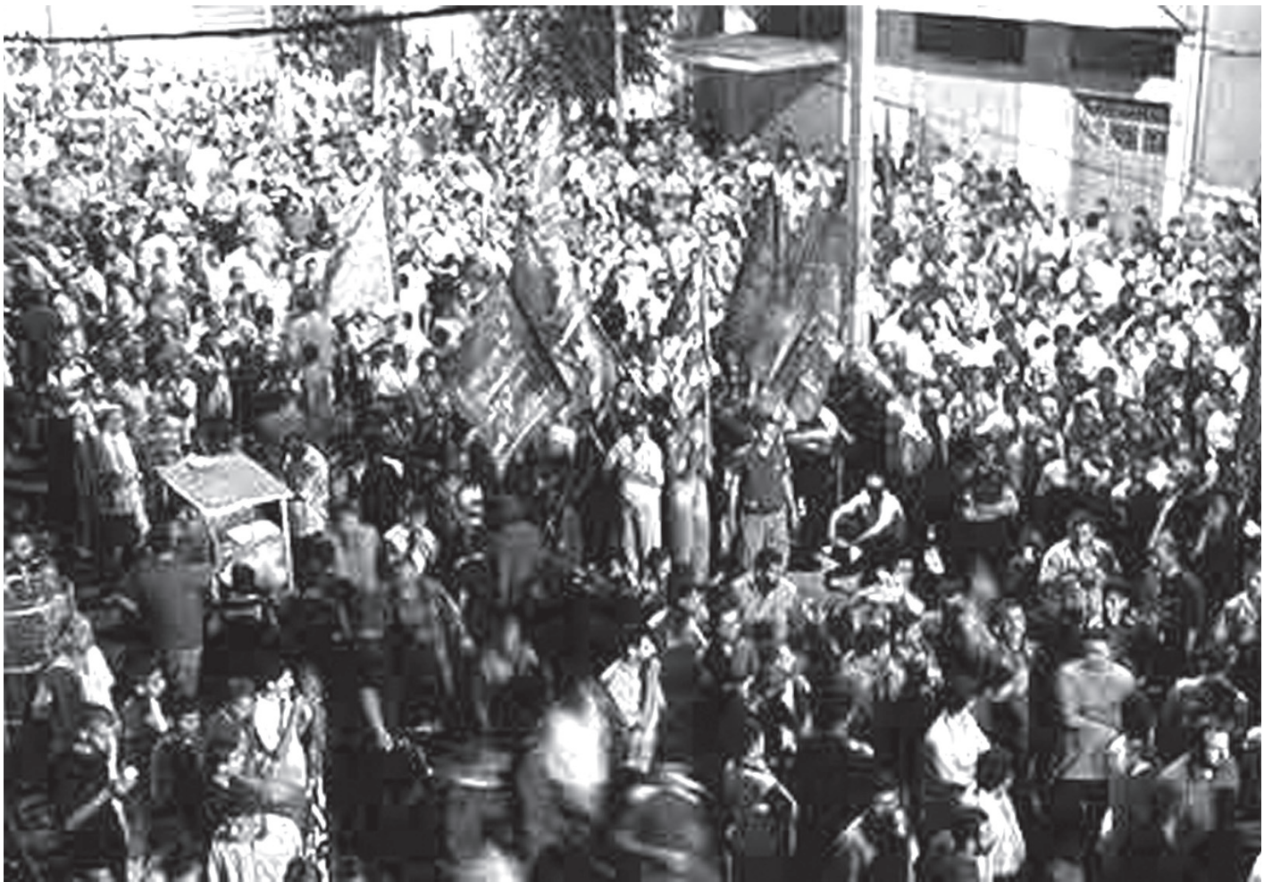
חמאס בעזה | החיכוך עם ישראל הוא אמצעי בדוק של החמאס לגיוס תמיכה ואהדה

אותו להיות מרוסן (יחסית) בהתגרריות שלו נגד ישראל. בכך ניטל ממנו מנוף פוליטי קריטי. יתר על כן, בשל הפיכתו לארגון צבאי למחצה שנוכחותו בולטת בשטח (ברשותו מוצבים, בסיסים, מחסנים, בתי מלאכה, כלי רכב וכו') קל יותר לצה"ל לפגוע בו. התנהלות הארגון אכן מעידה על כך שהולך וגדל חששו מפני פעולה נרחבת של צה"ל נגדו.