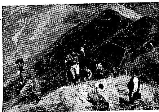
החוטפים המכותרים מפגשים דרכם אל חוף הים.