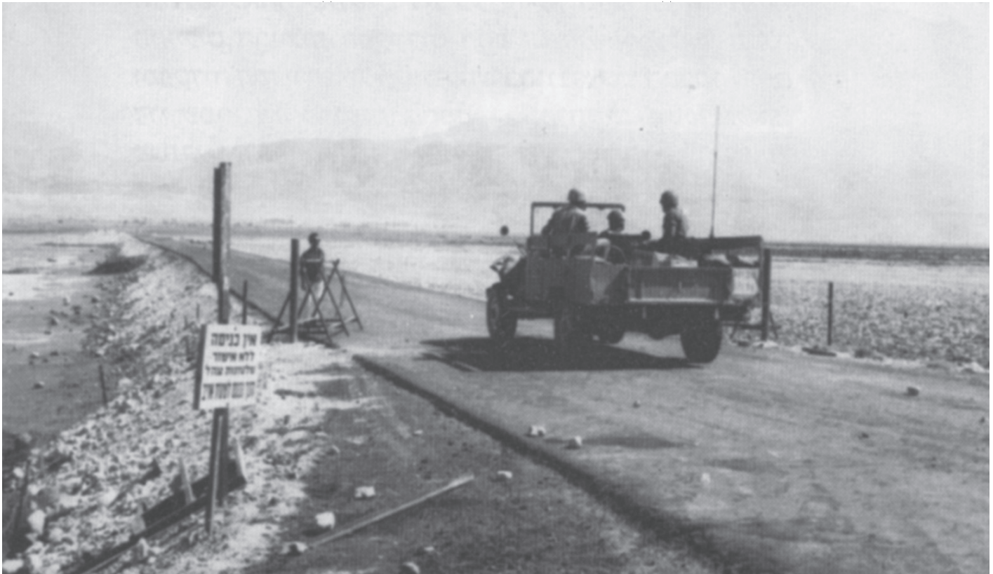
"ציר מימון" המוביל לצפי שבעבר הירדן | לגזרת הערבה הוקצו כוחות קטנים ואמצעי לחימה פחות מתקדמים מאלה שהוקצו לגזרות תעלת סואץ, בקעת הירדן ורמת הגולן - מה שחייב את המפקדים לנקוט שיטות לחימה לא שגרתיות