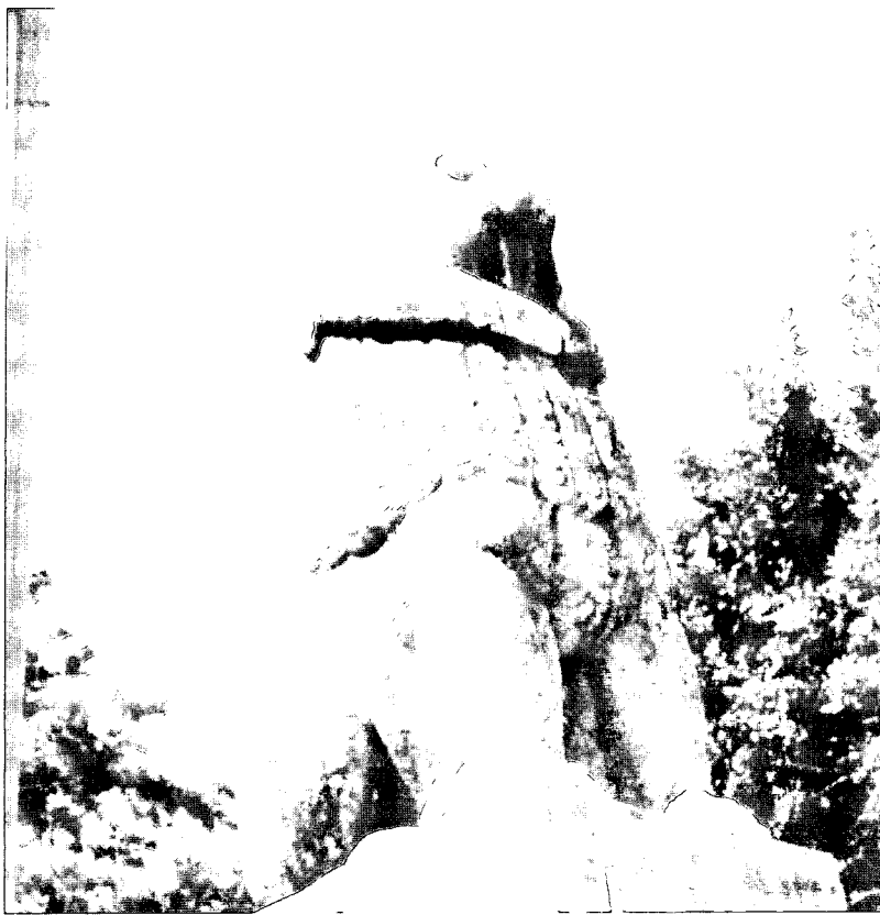
אנדרטת האר"ה השואה בתל-חי. למרגלותיה נשבעו אמונים דורות של לוחמי "השומר" וה"הגנה"

המיעוט עוד התנגד. הייתי מצעירי המגינים, ואף על פי כן העזתי וצירפתי את תביעתי הנמרצת לדורשים להוסיף ולעמוד. בין נימוקי המתנגדים לעזיבה היה גם הנימוק ההגייוני, שאפילו יוחלט על נסיגה, יש להחזיק, מכל מקום, מעמד משך היום ולצאת את המקום רק עם חושך; הן קרוב לוודאי שהמתנפלים יתקו בפנינו את דרך הנסיגה, ומכל מקום יגלונו כשאנו עולים על ההרים הקירחים מערבה בדרך אל ידידינו המתואלים. אך החלטת הנסיגה כבר נחרצה. העמסנו עלינו כל הנשק שיכולנו להעמיס, והשאר קילקלנו או פירקנו. לא הייתה