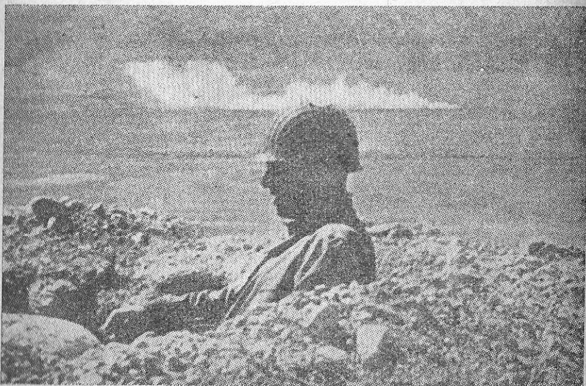
באותו איזור היה רוחבו של העמק כ־6.5 קילומטרים

היעד הבא היה הכפר גאבס, כשבועים וחמישה קילומטרים מזרחה משם. פני-הקרקע עד לשם היוו בעיקרו של דבר עמק מחוספס, המשתפל מן הרכסים שמשני עבריו — כ־700 מטרים גובהם — עד לגובה פני המדבר. בקצה העמק נמצאה גאבס.