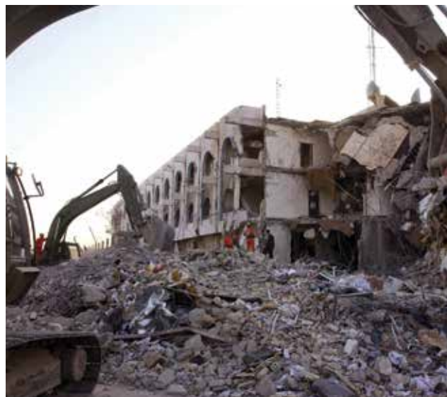
פיגוע של אליקאעדה בניין האו"ם בנג'אד. הנסיבות מחייבות את הארגון להתנהל בין סדר העדיפויות המקורי שלו ובין סדר עדיפויות שנכפה עליו מכוח המציאות

מצדדי האלימות ב"אחים המוסלמים" כבר נסמכים על מדרוך הלכתי שהופץ ברשת ב־2015 תחת הכותרת הלכות ההתנגדות העממית להפיכה. ספר זה מניח תשתית הלכתית להיתר שימוש מבוקר בכוח