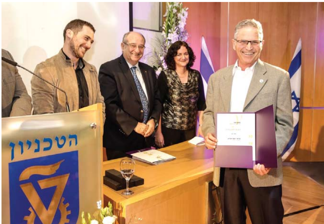
פרופ' יוסי אברון מהטכניון. לדבריו, אפשר היה לצפות שבוגרי העתודה האקדמית יתפתחו בתום שירותם הצבאי למובילי חזית המחקר והפיתוח בארץ ולחוט השדרה של האקדמיה

לא הולמים ותחושה של זלזול מצד גורמי הצבא ביחס לכוח האדם האקדמי. הטענות האלה באות לידי ביטוי בפורומים ובקבוצות שונות באינטרנט הפתוחים בפני מלש"בים השוקלים אם להצטרף למסלול. 10 מן הדו"חות האלה עולה שגברה תחושת אי שביעות הרצון ביחס לסקרים שנערכו בעבר..