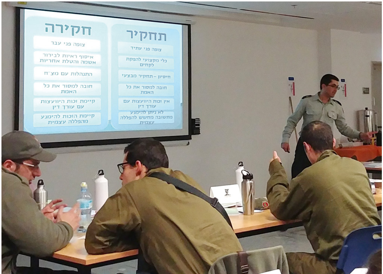
הרצאה של קצין מחקר והדרכה מטעם ביה"ס למשפט צבאי לקורס פיקודי לדרג הקצונה, במחנה קרית ההדרכה ע"ש אריאל שרון.

שמציבה כוח רב ואחריות רבה בידי המפקדים, האחראים גם על שמירה על המשמעת וטוהר המידות בצה"ל, שהם ערכי יסוד בארגון. מנגד, הפעלת כוח זה, שלא בהתאם לכללים, עלולה להוביל לפגיעה בזכויותיהם של החיילים וכתוצאה מכך גם לפגיעה במשמעת.