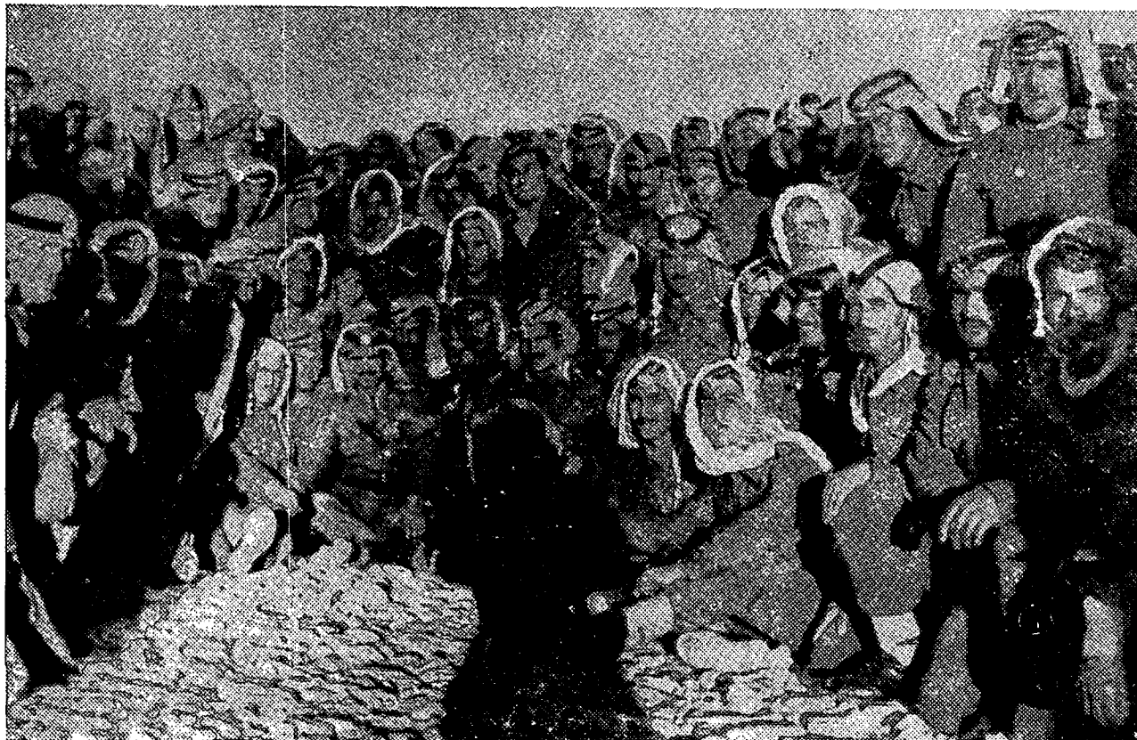
מקציני גדוד "אל-חסיין" מס' 2