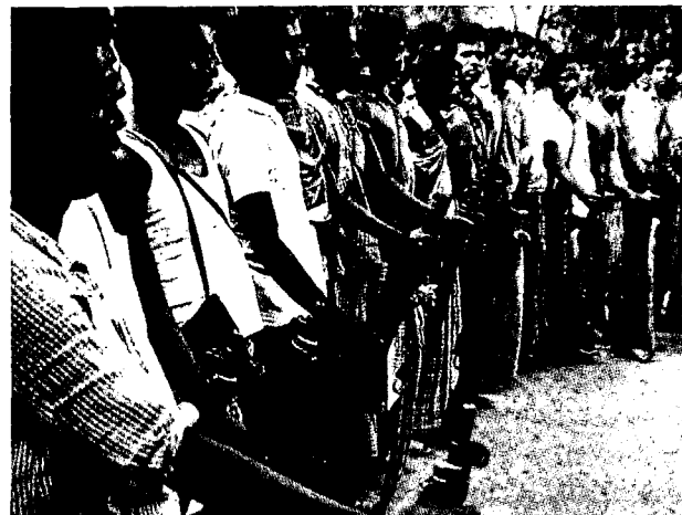
קבוצה של „מוקטי-בהיני“ באימונים.

הגברת גנדי הבינה כבר באפריל—מאי כי מאבק מזוין עם פקיסטאן, שיאלצה להחזיר את הפליטים ולהעניק אוטונומיה לבני-גל המזרחית, הוא בלתי-נמנע. כאביה, נהרו, השכילה לשלוט באורח מלא במאבק המדיני-צבאי, שלא ידרדר לעימות צבאי בטרם עת. היא הציבה לעצמה שלוש מטרות: נטרול דיפלומטי של האיום הסיני; השלמה של תכנית ההיערכות וההתארגנות מחדש של כוחותיה; ואימון ה-„מוקטי בהיני“ ללחימה יעילה.