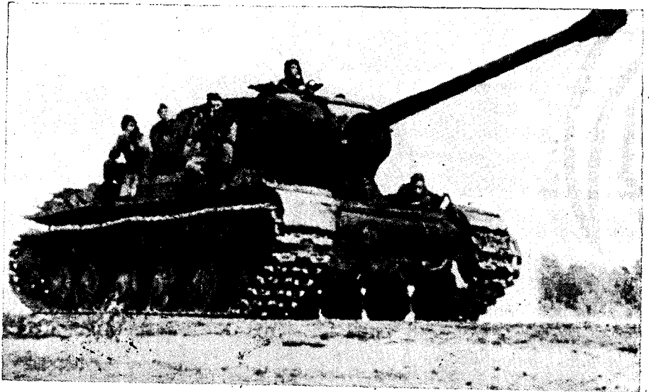
טנק סטלין, בס תוחח 122 מ"מ