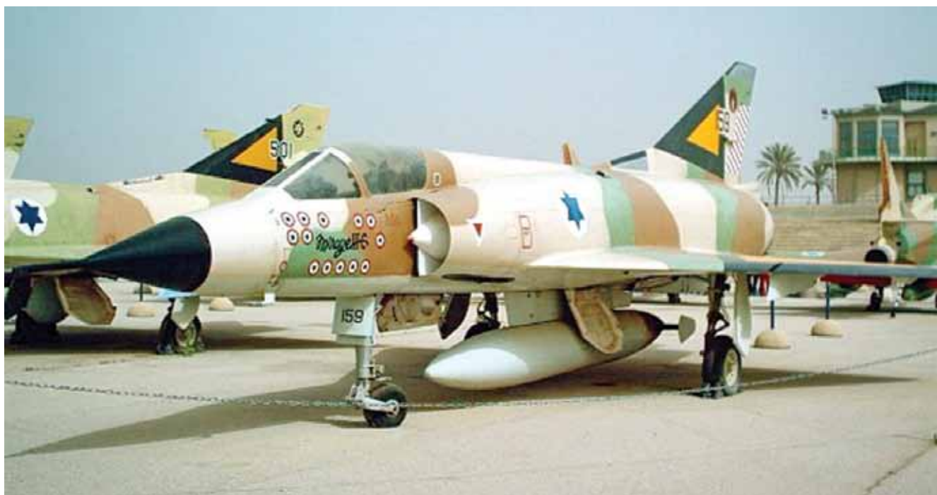
מטוס מיראז' ועליו סמלי הפלות | בספטמבר 1973 התפתח קרב אווירי במהלך גיחת צילום ישראלית מעל שטח סוריה, ובמהלכו הפיל חיל האוויר הישראלי 12 מטוסים סוריים. אמ"ן ראה בריכוזי הכוחות הסוריים תגובה לאירוע הזה ולא היערכות למלחמה

למתקפה מקדימה - צעד שצה"ל הכין והמליץ להוציאו אל הפועל. 45 כאשר אמ"ן ניסה לעמוד על כוונותיה של מצרים, הוא נשען במידה רבה על ניתוח של מאזן הכוחות - ניתוח שהיה שגוי בגלל האדרת כוחו של צה"ל והיעדר המידע (או ההבנה) שמצרים החליטה להשיג את מטרותיה המדיניות באמצעות מהלך צבאי מצומצם שתואם את יכולותיה הצבאיות המוגבלות.