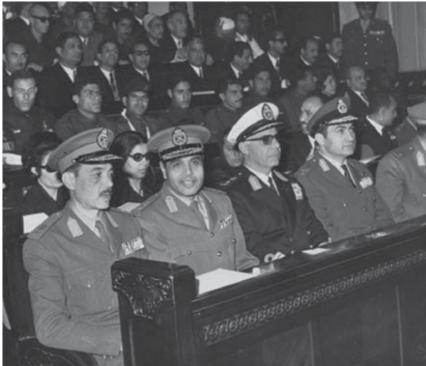
מובארק (ראשון מימין) ויתר חברי הפיקוד העליון המצרי במלחמת יום הכיפורים | לפני מלחמת יום הכיפורים עסק המודיעין של צה"ל, בין היתר, בחיפוש סימנים לכך שהערבים עושים הכנות לקראת מלחמה

שתהליכי בניין הכוח הם ארוכים מאוד. חסרונה העיקרי הוא שהבנה לא נכונה של מטרות המלחמה יגרמו לחישוב שגוי של יחסי הכוחות. יתר על כן, בהחלט ייתכן שהאויב מעריך שהוא מסוגל להשיג יותר מכפי שיכולותיו - אשר מוכרות לנו - מאפשרות לו, ובכך הוא יפתיע אותנו. ובמילותיו של משה דיין בשנות ה-50: "למרות מאזן הכוחות הקיים עלולים הערבים לעשות דברים בלתי הגיוניים" 16 .