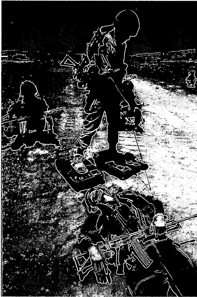
פסל מתאמן בחילוץ נפגע מתוך שדה מוקשים. כיום כבר יש לחיילים הקרביים תחושה שהמערכת משתדלת לתגמל אותם על מאמציהם המיוחדים

אין בכוונתי לומר כי אסור לנו לצייד את החייל את המפקד בשום מערכת של כלים ועיקרים. להפך. חובה עלינו להדריך אותו ולמנוע ממנו כניסה למצבים, שבסבירות גבוהה עלולים להסתיים בתאונה, אולם זאת על-ידי מספר מינימלי של הוראות ושל נהלים. וכפי שניסח זאת הפילוסוף הרומאי סנקה: "ראוי לו לחוק שיהא קצר למען הקל על הדיוטות את שמירתו". בצורה זו ייוותר בידיהם של כל חייל ושל כל מפקד די מרחב חופשי לשיקול דעת ברמתו. בכל מקרה עלינו להבין, כי תמיד נצטרך להפעיל מידה כזו או אחרת של שיקול דעת, ולכך עלינו לחנך ולהרגיל את המפקדים בכל הרמות.