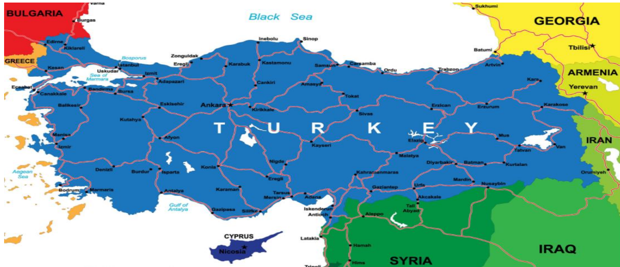
מפה 1: גבולותיה של טורקיה