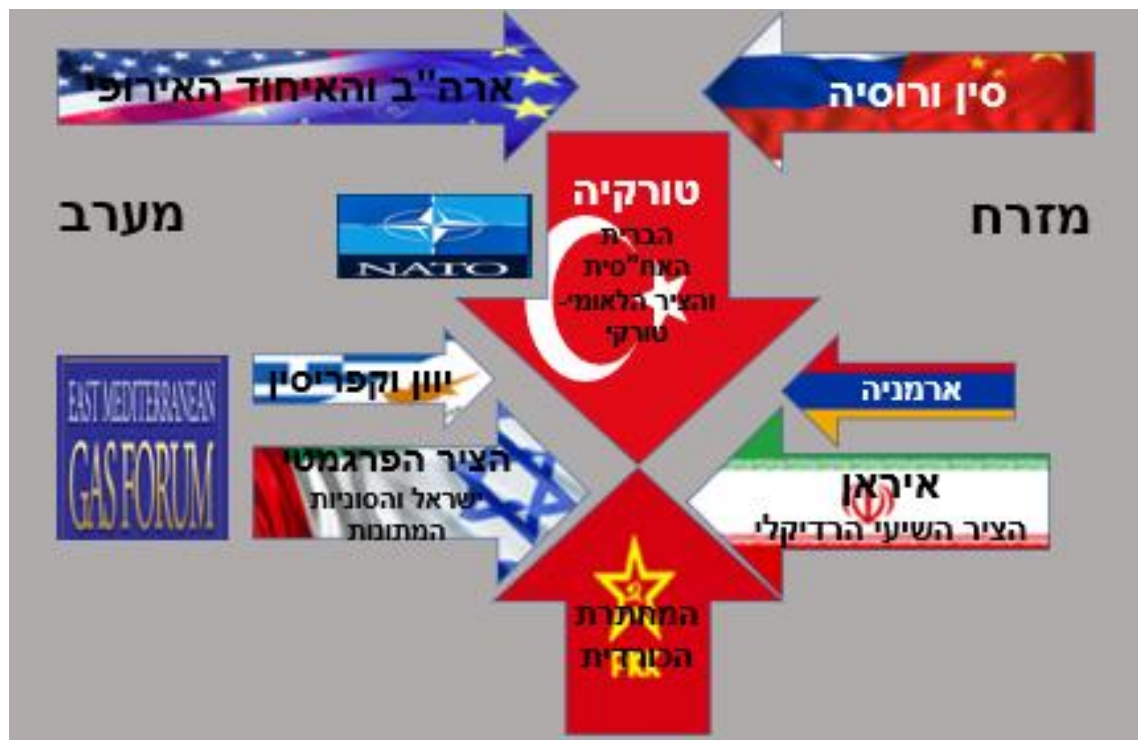
תרשים 3: המערכת הנוכחית – תמונת השחקנים והבריתות בראייה טורקית