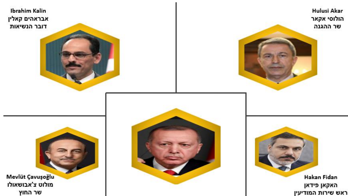
תרשים 7: גורמים המעורבים בתהליכי קבלת החלטות בנושאי מדיניות החוץ

אופי המשטר של מדינה משפיע על התנהלותה ברמה האזורית והגלובלית. מאז כישלון ניסיון ההפיכה ב-2016 ערך ארדואן שינויים מפליגים באופי המשטר הטורקי, והפך לשליט אוטוריטרי וריכוזי המדכא את מתנגדיו ביד קשה ובאורח לא דמוקרטי, ופוגע בין היתר במעמדו המיוחד של הצבא הטורקי, בזכויות האזרח ובעיתונות החופשית. להבנתנו, ארדואן הוא הגורם המכתיב את מדיניות החוץ ומקבל את ההחלטות המרכזיות. לצד זאת, אנו מזהים ארבעה גורמי כוח בטורקיה העוסקים גם הם בסוגיות של מדיניות החוץ הטורקית; ארבעת הגורמים הללו מהווים למראית עין "כוורת" קבלת ההחלטות של טורקיה בסוגיות של מדיניות החוץ.