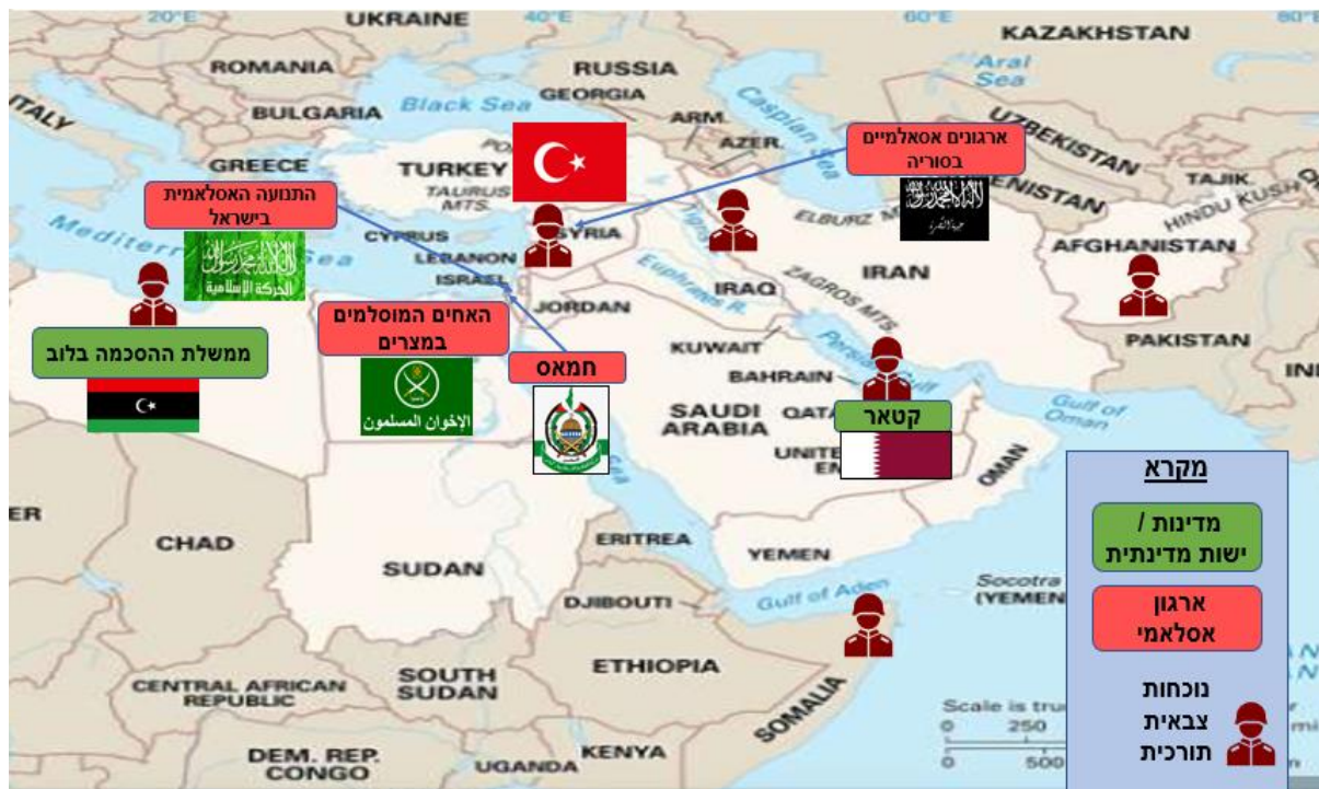
תרשים 4: קשרי טורקיה עם ארגונים וישויות על רקע אסלאמי ונוכחות צבאית טורקית

לצד כל אלה הגבירה טורקיה את מאמציה להתקרב למדינות מוסלמיות, גם אם הן אינן דוגלות באופן מובהק בתפיסות "האחים המוסלמים". בולטות בהקשר זה פקיסטאן, אינדונזיה ומלזיה (Daily Sabah, 8.3.2020). כמו כן, מדינות אלה מהוות יבואניות של אמל"ח מטורקיה. נוסף על כך, טורקיה אירחה בשטחה מספר כנסים של תנועת "האחים המוסלמים" הבינלאומית, שאליהם הגיעו מנהיגים מוסלמים ממרוקו, מאוריטניה, סומליה, עיראק, סוריה ולוב.