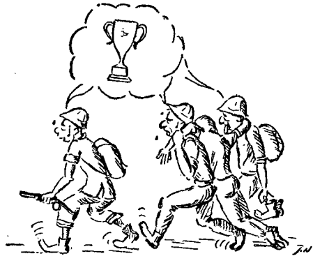
אל לו לגביע לשמש מין גורם אשר כדי לזכות בו מותר לאבד את ערכי רוח-היחידה.

קשה אמנם להגדיר "מדד" זה — ולמדדו לפי משקל, זמן, אורך וגובה — אולם קל למדי לתארו; שכן זהו מדד הנראה-לעין, והוא תוצאה של תופעות שאנו חשים בהן: — תופעות המעוררות כבוד והערכה לקבוצה, או תופעות אשר מעוררות סלידה, רוגז וקריאות-גנאי.