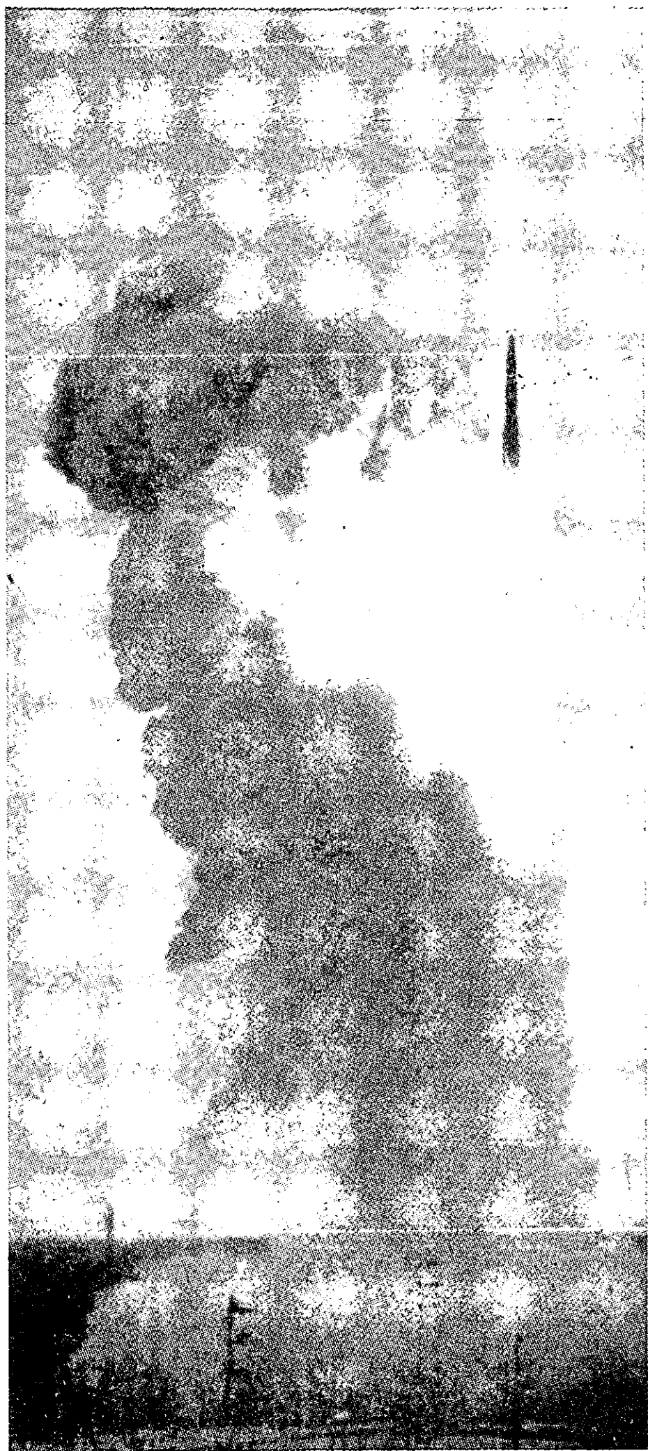
טייל "פולריס" במטופו

קאי. ההשוואה בין הנוחיות האמריקאית לפעול נגד קובה והנוחיות הסובייטית לפעול נגד תורכיה בהירה לחלוטין. ואמנם תמורת הוצאת הטילים הסובייטיים מקובה הוציאה ארצות-הברית את טיליה מתורכיה. משבר קובה היה תופעה יוצאת-דופן בכך שנוהל כולו באמצעים דיפלומטיים ולא הגיע להפעלת גייסות בשדה-הקרוב, בעוד שמרבית ההתנגשויות הפריפריאליות הקונבנציונליות התפתחו עד כדי שימוש רחב-מימדים בגייסות — אם בצורה חד-צדדית, כגון: ההתערבות האמריקאית