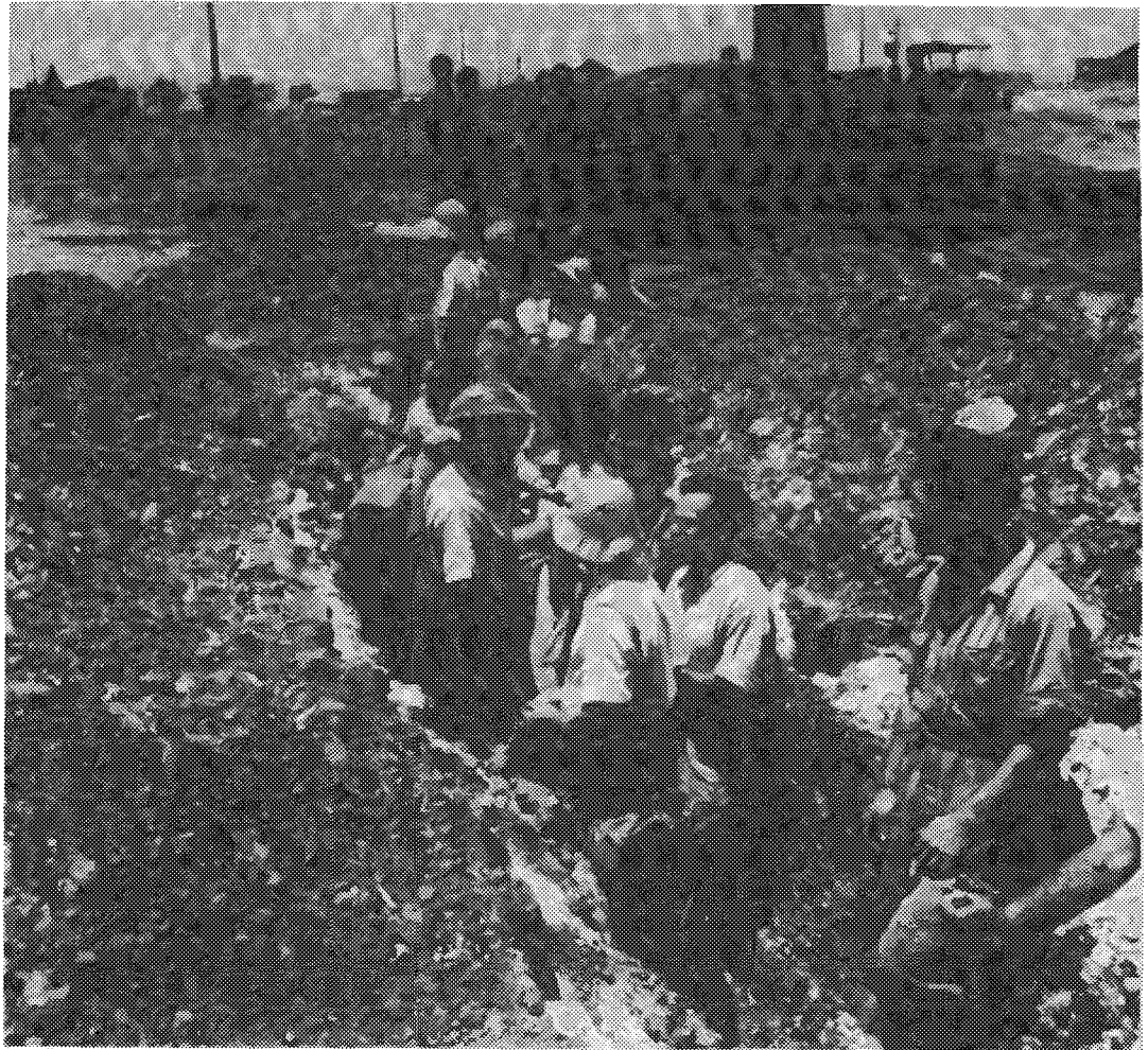
חופרים ביצורים בעמק יזרעאל

פעולה צבאית נגד ה"משולש" נידונה בממשלה הזמנית ב-19 בדצמבר 1948. באותה ישיבה דנה הממשלה גם על חידוש המלחמה בנגב במסגרת מבצע "חורב", שעתיד היה להביא את המצרים לשולחן המשא-ומתן. בישיבה החליטה