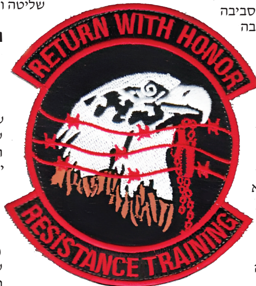
סמל מדריכי שבי בחיל האוויר האמריקני ככל שהזמן עובר החיילים מתרגלים לסביבתם החדשה - מה שעוזר להם לשרוד

שתי הנחות חשובות עמדו בעת כתיבת המסמך: 1. יש הבדל בין הסתגלות מחדש של חיילים שבויי מלחמה ובין זו של שבויים אחרים, בשל ההבדל במאפייני האישיות, במוטיווציה ובציפיות. על כן יש צורך בשימוש בטכניקות שונות. 2. הטכניקה של התחקיר הטקטי המבצעי שמשמשים בה כדי להחזיר את האדם לחיים חדשים, מסייעת לצוותים המטפלים לאסוף מידע בלי לגרום לנזק נוסף. אסור שהדבר יפגע בתהליך של השילוב וההסתגלות; כלומר אי אפשר יהיה להשתמש בטכניקה זו למטרות של הבראה, אם השבויים יפחדו שמה שיספרו ישמש נגדם.