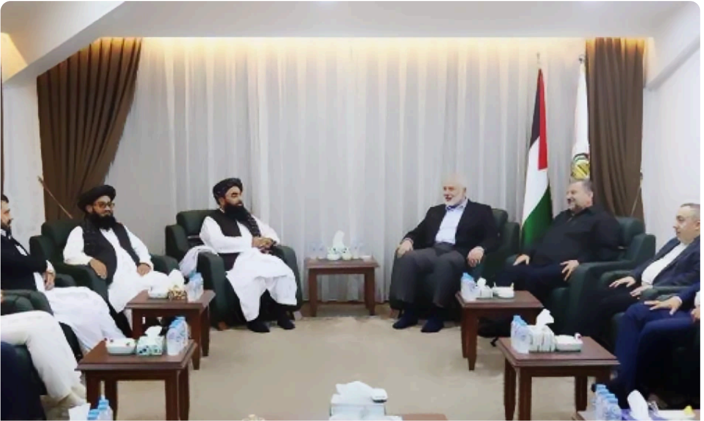
מפגש פסגה בין בכירי חמאס לבכירי טאלבאן.