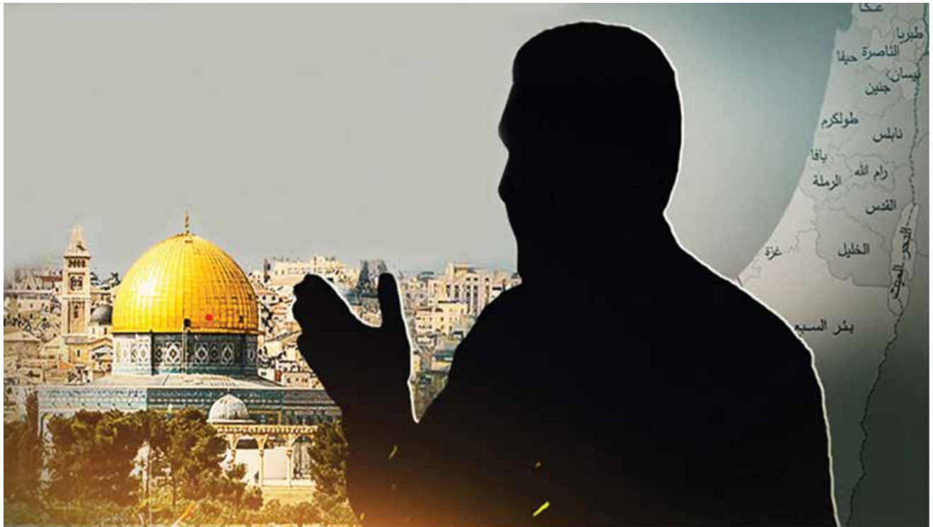
הצללית של מחמד אל־צ'יף, מפקד גדודי עז אל־דין אל־קסאם. הוא פעל במערכה זו בהשראת קרב בדר.