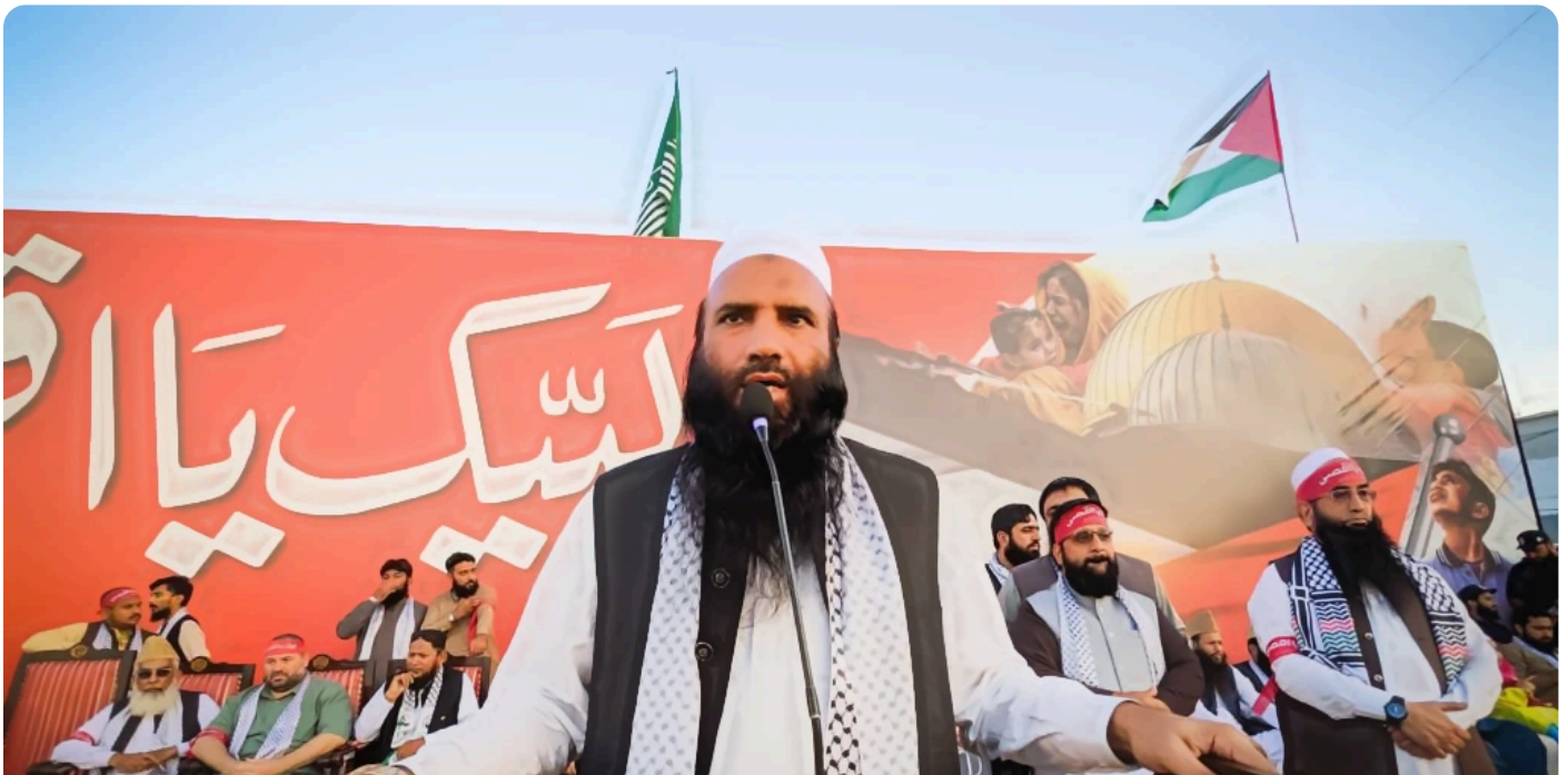
הפגנה פרו-פלסטינית בקראצ'י, 12.11.23.

על אף היחסים הגלויים והנסתרים בין שני ארגוני הטרור, הטאלבאן הכחיש כלפי חוץ כל כוונה לשלוח את לוחמיו ללחימה בעזה, ובכיריו התבטאו בצורה מתונה יחסית בנוגע לחמאס. 19 הסיבה לכך היא שהארגון מעוניין להתנער ככל הניתן מהדימוי הרע שנוצר לו בעולם, ולהימנע מהפרה (נוספת) של הסכם דוחה שחתם עם האמריקנים ב־2020, ואשר בו התחייב שלא לסייע לארגוני טרור שונים הפוגעים בארצות הברית. הסכם, שלמרבה האירוניה, הטאלבאן הפר לא אחת, על אף הכחשותיו הגורפות. 20