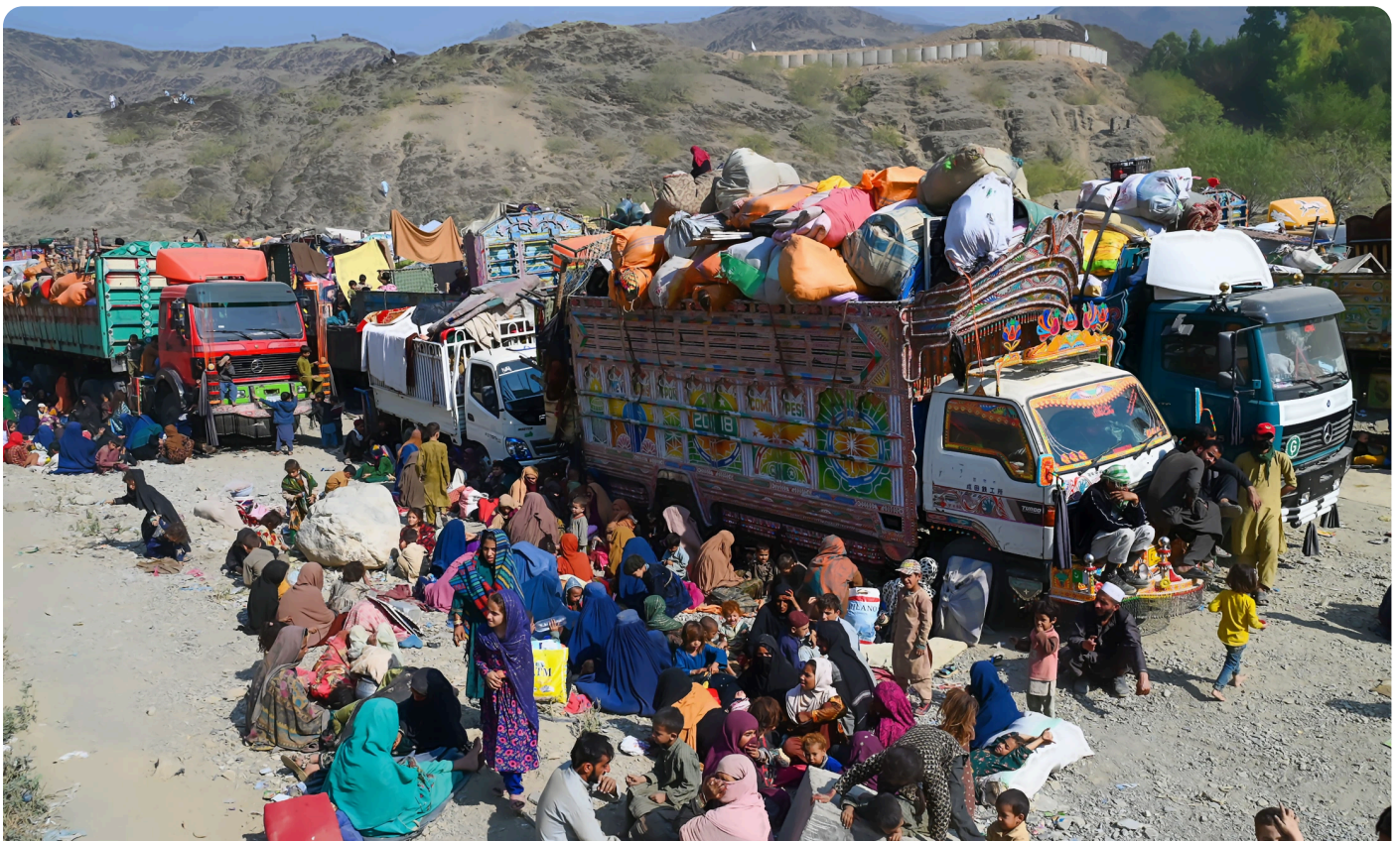
פליטים אפגאנים

מלחמת "חרבות ברזל" יוצרת הזדמנויות שונות למדינות ולארגוני טרור בעולם המוסלמי להתקרב לציר כזה או אחר. פקיסטאן הגרעינית ואפגניסטאן, שמשמשת מקלט בטוח לארגוני טרור, הן שחקניות חשובות ובלתי צפויות שיש לשים לב אליהן. מאמר על בעיית פליטים חדשה שלא זוכה לתהודה מספקת