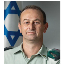
אלי"ם ד"ר לוסיאן טצה לאור , פסיכיאטר ורמ"ח ברה"ן בחיל הרפואה