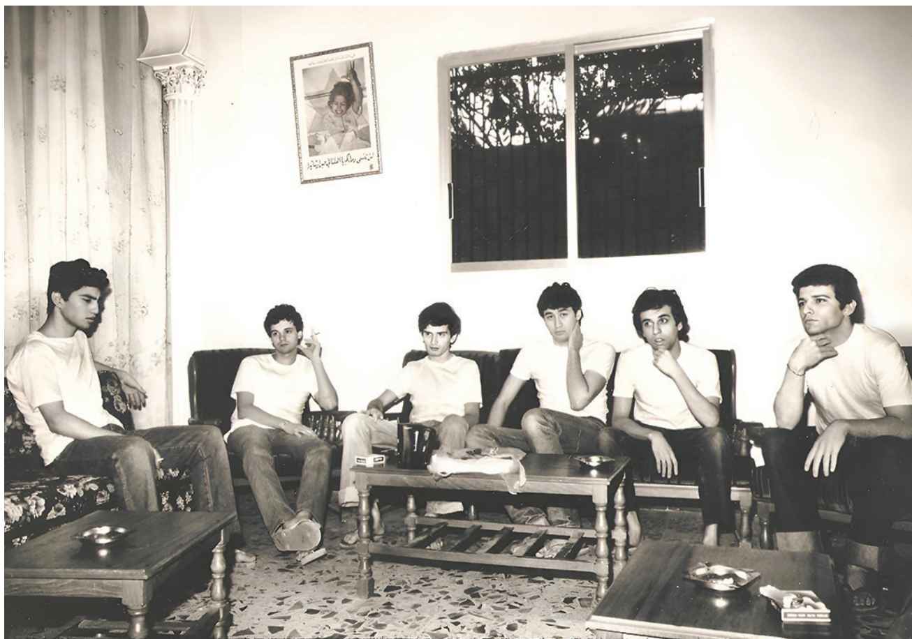
לוחמי הנח"ל בשבי בלבנון, 1982. החברה הפכפכה למדי בכל הנוגע לאופן שבו היא רואה אנשים שחזרו מהשבי.

באמצעות איסוף מידע מודיעיני רב ערך חשוב לעיתים יותר מהמפגשים המשפחתיים. תחקיר טקטי רגיש בזמן הוא האירוע המכריע ביותר עבורם במהלך השעות הראשונות לחזרתם, לפני שהם נכנסים לתהליך שיקום. במידע טקטי רגיש יש תכנים שעשויים להציל חיים מיידית, לעזור להביס את האויב ולהשלים את המשימה. נושא השלמת המשימה רגיש מאוד לזמן, וככל שהוא חולף - היכולת לעשות בו שימוש מועיל במסגרת תהליך ההתאוששות פוחתת.