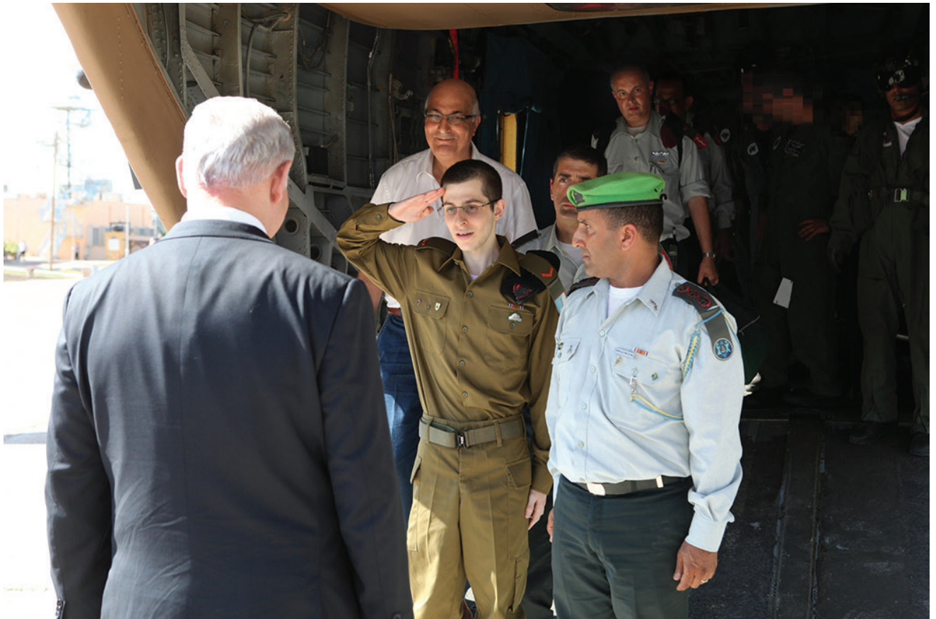
המפגש בין ראש הממשלה בנימין נתניהו לרס"ל גלעד שליט בעת שובו לישראל לאחר שחרורו מן השבי, 18 באוקטובר 2011. תוכניות פעולה מותאמות לפדויי שבי כרוכות בתכנון מצבים שצפויי שייאלצו להתמודד עימם בשוכם הביתה, ובהדרכה מתאימה להתמודדות זו.

חוסן נוקטים פרספקטיבה ארוכת טווח ובוחרים לפתח תוכניות לעתיד. גישה זו נתמכת בהתמקדות בהצלחות קודמות, ובראיית אתגרים כמכשולים שניתן להתגבר עליהם. רבים מפדויי שבי שחוו כישלון במשימה מתמקדים בתחושות חוסר האונים שלהם ובטעויות, נתפסות או אמיתיות, שנעשו במהלך הבידוד וההתאוששות. חוקרי שילוב מחדש ופסיכולוגים מכירים בתחושות ובחוויות אלה, אך מתמקדים גם בפעולות המובילות להישרדות. התמקדות בפעולות אלה תומכת בפיתוח נקודת החוסן, ונעשית דרך שאילת שאלות מתאימות, למשל: "זה בטח היה מפחיד (יש להשתמש במילים שלהם), איך התמודדת?", או "מה עשית כדי לשרוד?". הכרה בחוויותיהם ובמצבם הרגשי משמשת כפונקציית נורמליזציה. קבלת מצבם הרגשי, תוך מיקוד בפעולות שנקטו כדי לשרוד, תומכים בפיתוח החוסן והביטחון. יתרה מכך, לתהליך יש יתרון של שיפור הבניית הזיכרון, תוך הכחדת רגשות מועצמים הקשורים לאירוע השבי או הפחתתם.