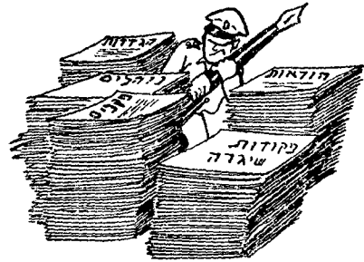
„נגשים לסיכום תוך ניתוח מדוקדק של עבודת המטה“