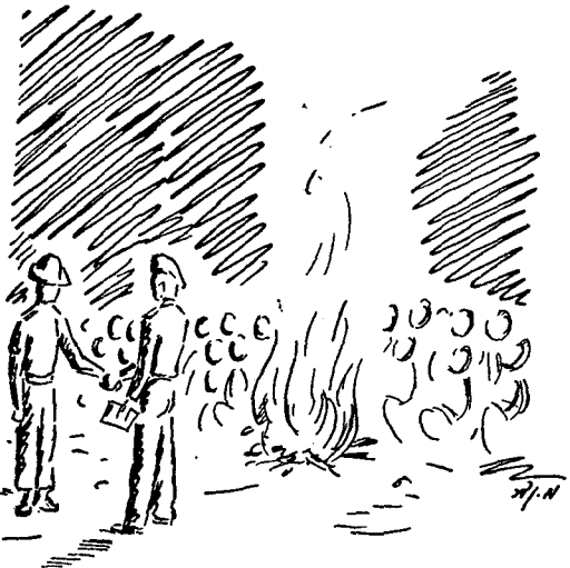
„ונקיים טכס לקבלת גדנשים...“

אין ספק כי ימצאו מערערים ומתנגדים לרעיון „המיליטריסטי“ של שילוב הגדנ"ע במערכת המל-חמה, כשם שיש מתנגדים לעצם קיומו של הגדנ"ע. הללו שוכחים ומשכיחים את עובדת היסוד שאויבינו הצרים עלינו — עולים עלינו במספרם ובציודם עשרת מונים, גם גיוס טוטאלי, באם יוכרזו במדי-נתנו, לא ישנה את יחסי הכוחות הללו, ולא יהיה