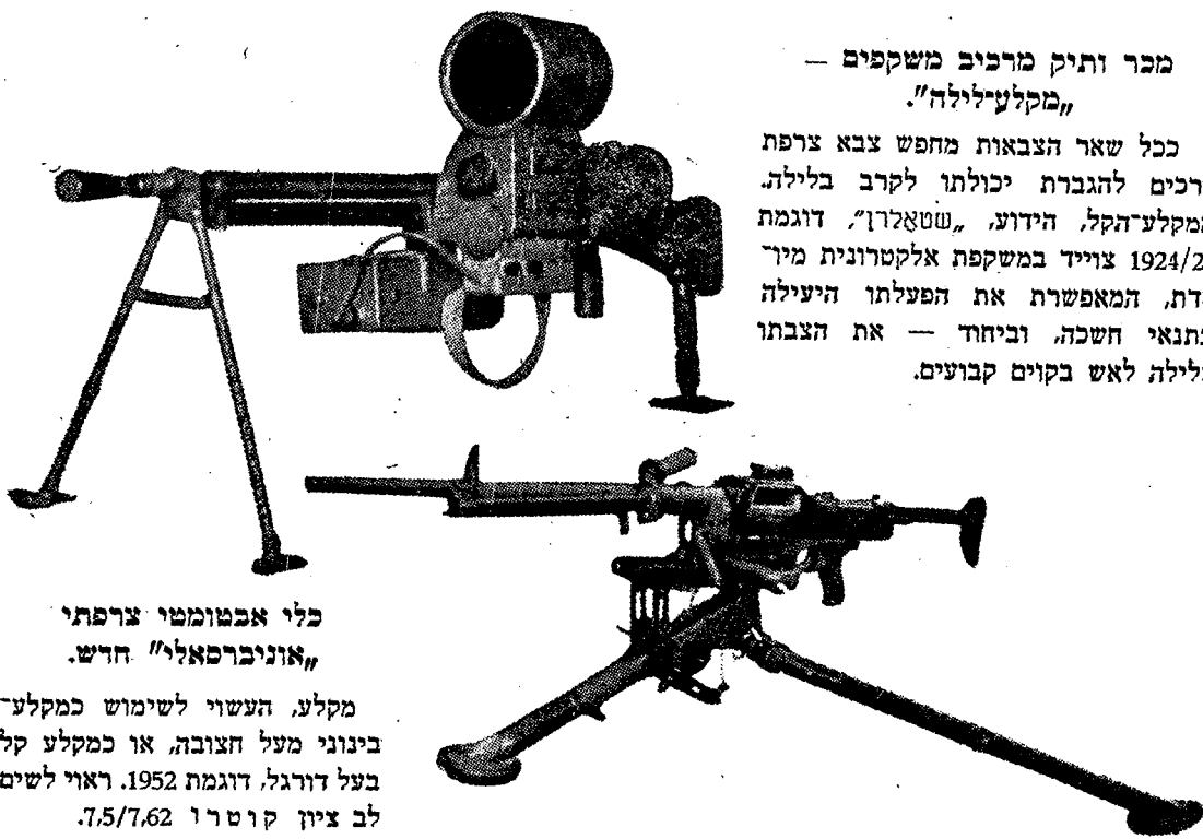
כלי אבטומטי צרפתי „אוניברסאל“ חדש.

ככל שאר הצבאות מחפש צבא צרפת דרכים להגברת יכולתו לקרב בלילה. המקלע-הקל הידוע, „שטאלרו“, דוגמת 1924/29 צוייד במשקפת אלקטרונית מיר חדת, המאפשרת את הפעלתו היעילה בתנאי חשכה, וביחוד — את הצבתו בלילה לאש בקוים קבועים.