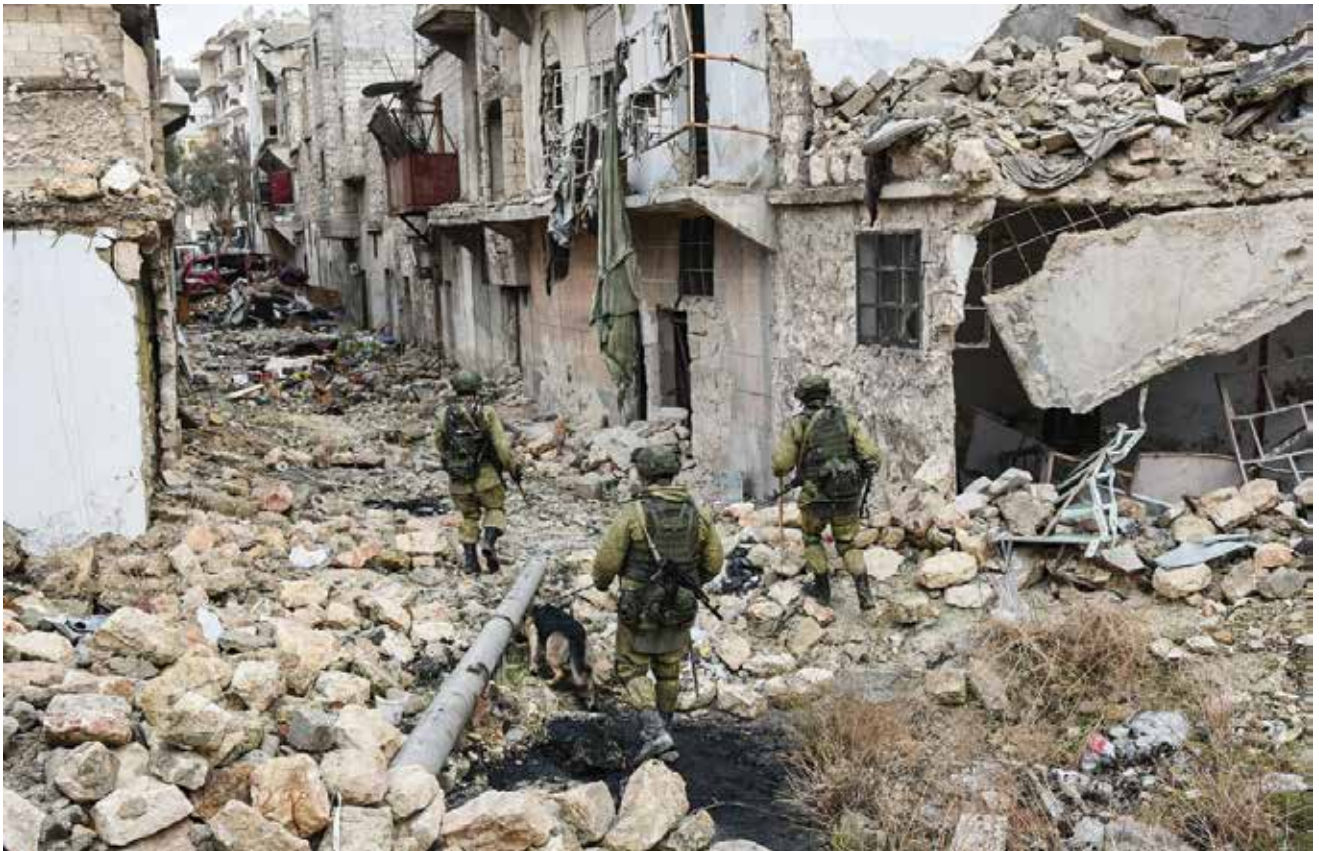
חבלנים רוסיים בחלב, דצמבר 2016. ההתערבות הצבאית הרוסית החלה לאחר שנראה היה שמלחמת האזרחים משמעה תבוסה הדרגתית של המשטר

מלחמת האזרחים בסוריה שימשה כר פורה לצבא הרוסי ליישום לקחים טקטיים וטכנו-טקטיים. חלק מהלקחים שנלמדו במהלך המלחמה היו אשרור של תהליכים שכבר קיימים בצבא הרוסי - חלקם רלוונטיים למלחמה בעצימות גבוהה, ואחרים נוגעים רק למבצעי התערבות במדינה אחרת