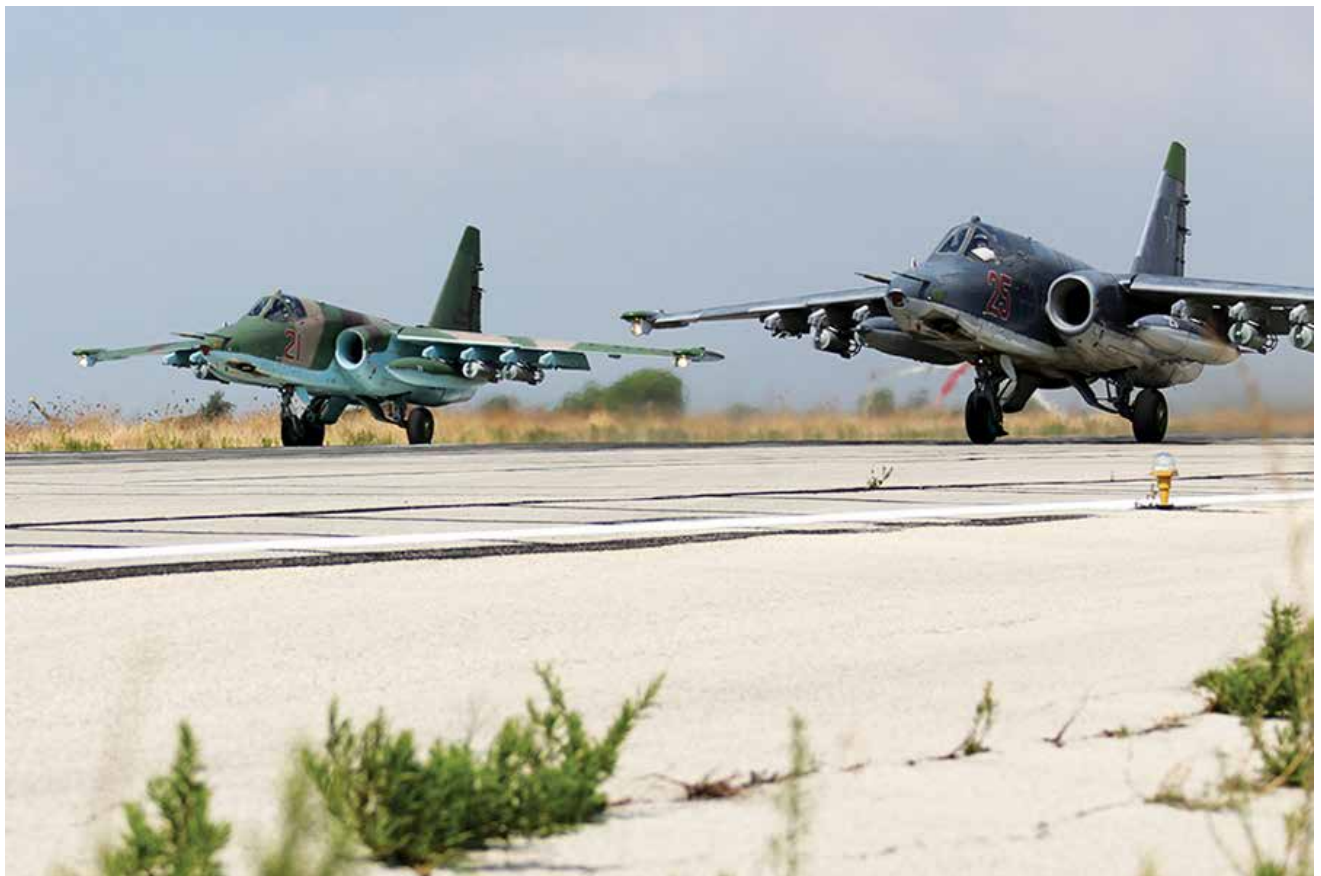
שני מטוסי סוחוי Su-25 בנמל התעופה בלאד'קיה. הלחימה בסוריה אפשרה לצבא הרוסי ליצור שילוב טוב יותר של חיל האוויר בתהליך התקיפה ולבחון פיתוחים טכנולוגיים חדשים, בעיקר בתחום השו"ב והפוי"ש

משלה. ברמה האסטרטגית, הכטמ"מים הוכיחו שהם בראש ובראשונה אמצעי מודיעין. אבל כטמ"מים תוקפים הן הקיימים והן העתידיים - אינם צפויים להיות אפקטיביים. 29 המטוס גדול-הממדים והאיטי פגיע מול אש נגד מטוסים. כדי להבטיח דרך מערכות ההגנה האווירית נדרש לפתח תפיסה אחרת של כטמ"מים תוקפים או מערכת שדומה בתכונותיה למטוס מאויש מודרני, או להשתמש בהרבה כטמ"מים קטנים. האפשרות האחרונה רואה בכטמ"מים נחילים הנעים לעבר המטרה, [לכן] השמדתם על-ידי הגנה אווירית אינה אפשרית. 30 למרות הסתייגויות שונות, באוקטובר 2017 ציין שר ההגנה שויגו כי הצבא הרוסי החל לפתח כטמ"מים תוקפים. שויגו הבהיר שהכוונה היא לייצר כ-300 כטמ"מים תוקפים כל שנה. נכון לכתיבת מאמר זה (קיץ 2020), כל כטמ"מי התקיפה שהוצגו לציבור על-ידי הצבא הרוסי הם קטנים ונושאים חימוש קל בלבד. 31