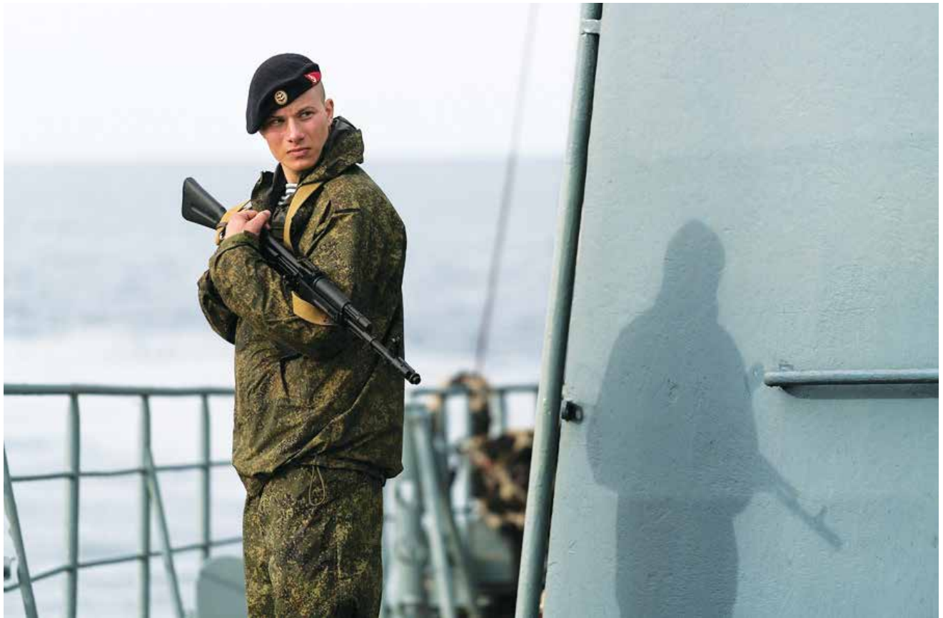
נחת רוסי על ספינה בחופי סוריה. מבנה הפיקוד והשליטה הרוסי שהוקם בסוריה נועד לכך שקציני הצבא הרוסי ומפקדיו יהיו מעורבים כמעט בכל רובד של הלחימה היבשתית בסוריה