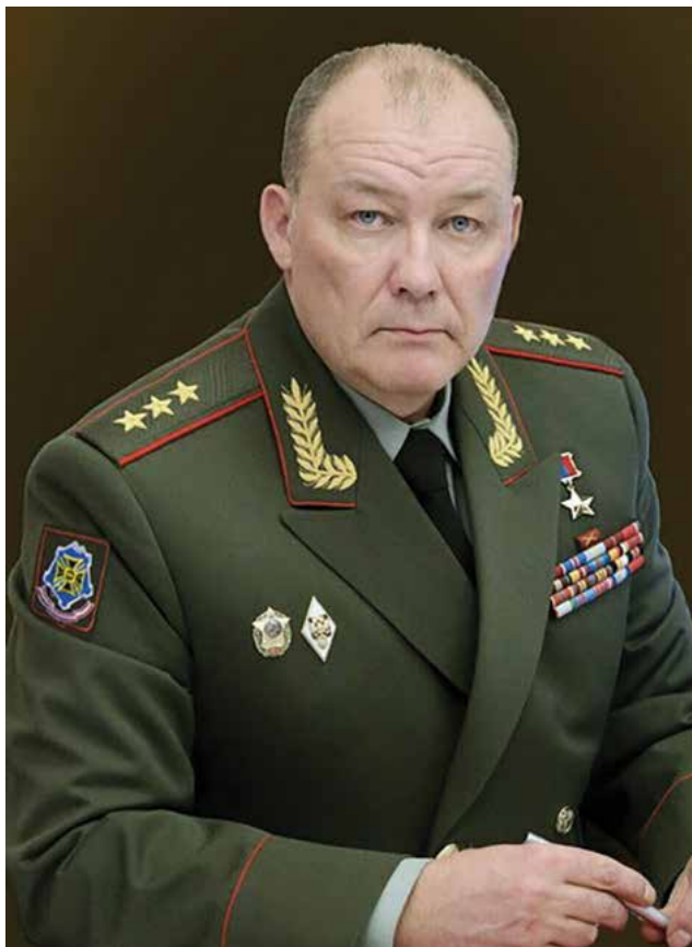
גנרל אלכסנדר דבורניקוב. הלחימה אפשרה לצבא הרוסי לבחון כיצד תהליך החשיפה-תקיפה פועל במצבים שונים מאלה שבהם הורגל, ובמיוחד בלחימה בלתי סדורה

הפעלת האש הרוסית בסוריה משקפת את תחילת השינוי שחל בהפעלתה וביישומה באמצעות שילוב בין נכסי אש ובין כוחות תקיפה יבשתיים. שינוי זה 13 חיזק את החיבור בין המסתייע ובין המסייע, ואפשר להקצות קנים רבים יותר בסיוע ישיר לדרגים זוטרים, ובכך להגמיש את ההפעלה ולזרז את תגובת האש לכל מטרה. כך, למשל, במקום ריכוז כל האש המסייעת ברמת החטיבה 14 והאוגדה, כפי שהיה נהוג בעבר, החלו להקצות לכל גדוד תוקף שלוש סוללות בפיקוד ישיר של מפקד הגדוד - וכך, למעשה, זכה כל גדוד מתמרן לסיוע שווה ערך של גדוד אש. זאת נוסף על הקצאת שניים או שלושה גדודי אש לדרג החטיבה.