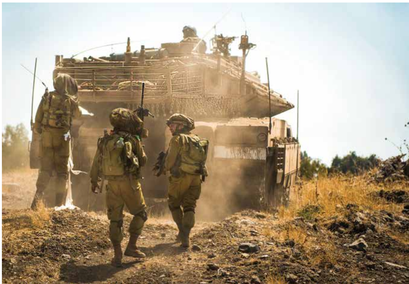
חטיבה 7 באימון. "כאשר אתה לא מתאמן - הטנקיסט פחות טוב כטנקיסט והקרב המשולב פחות טוב".

'מעצבנת'. היא כל פעם מרימה את הראש בצורה אחרת, וקשה מאוד להזניח פנים שונות שלה".