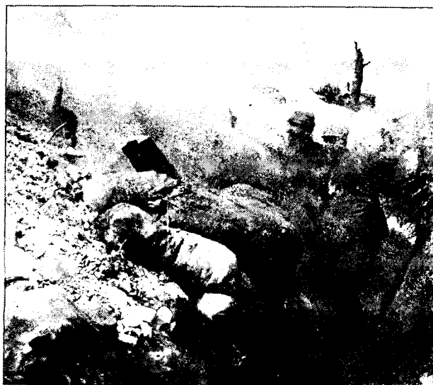
מלחמת חפרות בארגון

במשך עשרה ימים, במחצית מאי, היתה פלוגה ט' נספחת לרגימנט חי"ר ה-67, שנמצא במרכז הארגון ליד בגטל, לצדו של רגימנט הגרנדירים ה-123. יחידה תוקפנית זו היתה מדול-דלת, כתוצאה מהתקפות וקרבות-רימונים רבים. כאן שררה לוחמת חפרות מסוג אחר. לעמדות מגן בפני אש ארטילריה ומרגמות לא יוחס ערך רב. כל הקרב התנהל בטווח רימון, מתוך שוחות שטוחות ומאחורי קירות נמוכים של שקי-חול. בסביבת בגטל נותרו רק שרידים מועטים שהעידו כי הארגון היה יער צפוף לפנים, שכן אש הארטילריה הצרפתית השמידה את כל העצים, ובמרחק קילומטרים נראו רק הגדעים. בעוד המפקד הנמוכים מסיירים את השטח לפני קבלתו, פרץ קרב קצר, אך עז, של רימוני-יד בחזית רחבה, ובו נגרמו לנו מספר אבדות. היתה זו דוגמה לאשר צפוי לנו!