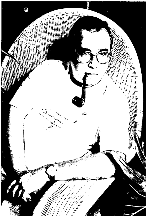
"אינסטינקטים מסוימים לבעיות אופרטיביות אינם יכולים להיות תחליף להכשרה מקצועית"

אלון ודיין עטורי הילת המנצחים ממלחמות 1948 ו-1956 היו מהבולטים שבין הוגיו של רעיון הצבא שהוא "צעיר לנצח". לדברי אלון, "ההכרח המתמיד בשינויים ובפיתוח עלול להיות למכשול לשירות מתמיד של מפקדים מזדקנים... מחזור דם רצוף ושילוב דורות בלתי פוסק הם תופעות רצויות בשירות הצבאי". 35 ייתכן כי מי שהיה אלוף מחונן ומצליח בגיל 30 התקשה לתפוס את המשמעות ההרסנית לאורך זמן של רעיון המפקדים הצעירים והכריזמטיים נטולי הידע המקצועי. משכי הכשרה והתנסות ארוכים אינם עולים בקנה אחד עם התפיסה של יציאה המונית לפרישה בגיל צעיר יחסית.