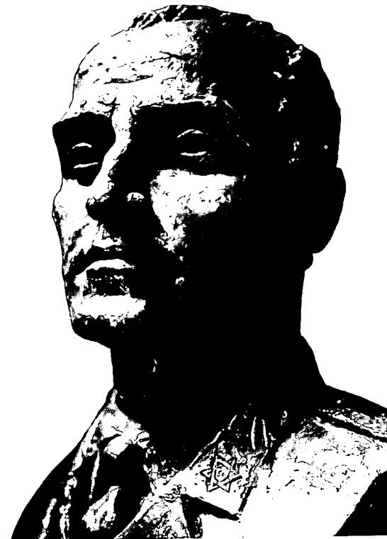
יוסף טרומפלדור – סגן מפקד גדוד במלחמת העולם הראשונה ומפקד תלחי

בספרה "חרב היונה" כותבת ההיסטוריונית אניטה שפירא: "הרתיעה המסורתית של המנהיגות הציונית מפני זיהויה עם ששון אלי קרב לא נבעה אך ורק מתוך ההכרה האוניברסלית בגנרתה של המלחמה ובתפארת השלום, אלא ממערכי נפש עמוקים יותר. רתיעה זו נתנה ביטוי לסלידתו של היהודי מפני השימוש בכוח". 9 ועוד כתבה: "מדינת היהודים דהיום (1992 – י"ו) מאופיינת, בין השאר, בעוצמתה הצבאית ובנחישות לוחמיה". 10 שפירא טוענת כי חל שינוי מהפכני באתוס הלאומי בכל מה