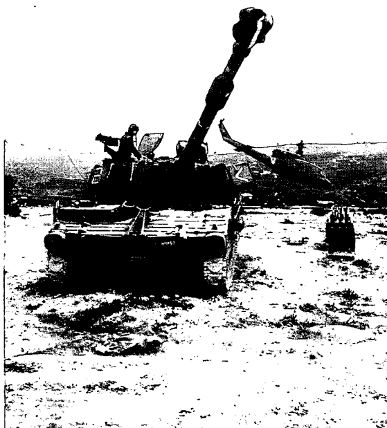
מבצע "ענבי־זעם" – תומיית ומסקי"ר חוברים יחדיו בפעולת עונשין בדרום לבנון

שיטת "הצבא הצעיר" הביאה לכך שחלקים נרחבים מהקצונה בצה"ל עסוקים בעיקר בהכנות לקריירה השנייה