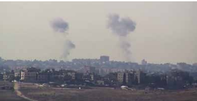
תקיפת צה"ל ברצועת עזה במבצע "עמוד ענן", 2012. האפשרות לנהל מלחמה מרחוק מתקבלת בברכה בחברות מערביות המבקשות להימנע מהסתבכויות ומנפגעים

לעומת זאת, התרחבות האימפריה הרומאית והאימפריות האירופאיות מן המאה ה-15 ועד למחצית הראשונה של המאה ה-20 התמקדה בשינוי הבעלות על שטחים. זו בוצעה על-ידי כיבוש צבאי, התיישבות והקמת מנהל ממשלתי של הפולשים על העמים הכבושים, ובחלק מהמקרים גם כפיית תרבות הכובשים על הילידים עד כי האחרונים הפכו לחלק בלתי נפרד מהקהילה הכובשת. 9 עם זאת, במאה ה-19 חזר בהדרגה הרעיון של השגת זכויות-יתר כלכליות ומדיניות על חשבון היריב, בלי להעביר בעלות ממשית על השטח.