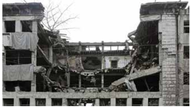
הריסת בניין בבלגרד, סרביה. המלחמה בקוסובו ב-1999 נוצחה לכאורה באמצעות כוח אווירי בלבד, אך סביב ניצחון זה עדיין נסובה מחלוקת.

הטיעון המרכזי של זרועות היבשה נותר אותו טיעון: בנסיבות רבות ומול אויבים רבים, הירי-מנגד וההפצצות מהאוויר לא יספיקו כדי להשיג עבור ארצות-הברית את ההכרעה הצבאית הנדרשת למימוש מטרותיה המדיניות. במצבים אלה יזדקקו לכוחות יבשה שיתמרנו בשטח, ימנעו כיבוש שטח על-ידי האויב או יכבשו שטח מידי האויב, ויעצימו את קצב השמדת כוחותיו ונכסיו מעבר לקצב האפשרי באמצעות ירי-מנגד או הפצצות מהאוויר.