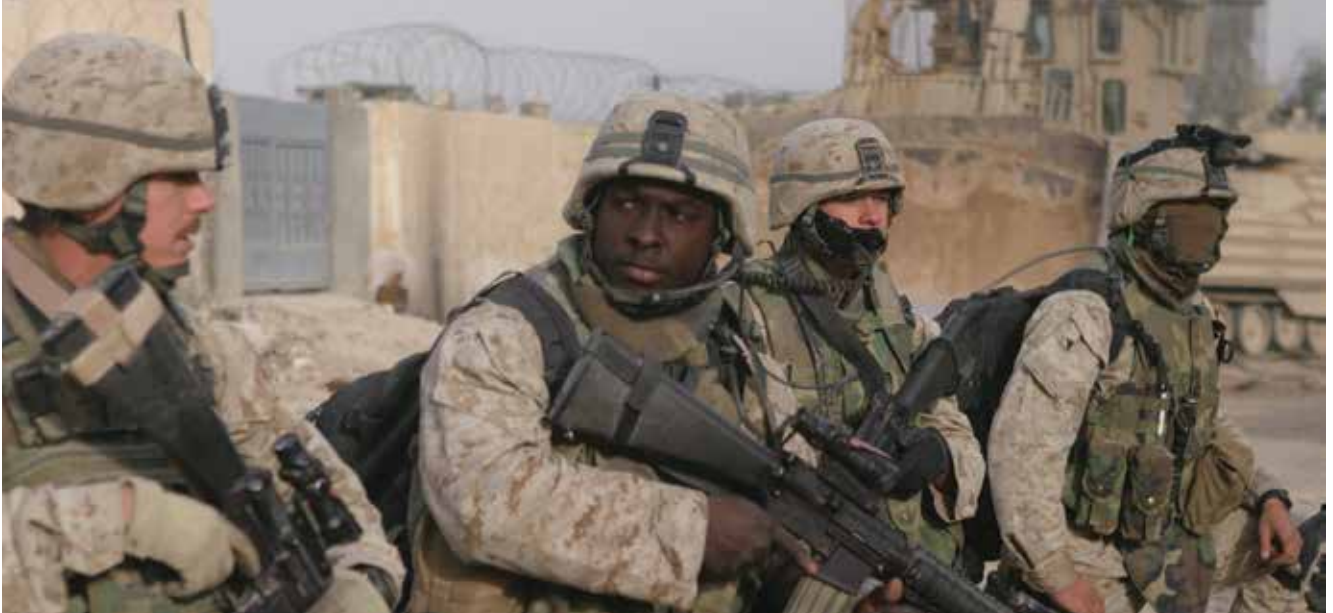
מחלקת ההנדסה של חיל הנחתים האמריקני בעיראק, 2004. בכמה ערים בעיראק עוצמת ההתקפות נגד האמריקנים הסלימה עד כדי כך שהאמריקנים נאלצו לכבוש מחדש את הערים הללו

הייתה להשפיע על האויב שלא יוכל להתחבא ולהחביא את נכסיו מאחורי חומותיהן של מצודות. כמו כן, בניגוד לספינות התותחים, יוכלו מטוסי הפצצה להגיע למטרות המצויות עמוק בלב ארצו של האויב ואף לארצות ללא חוף ים כלל.