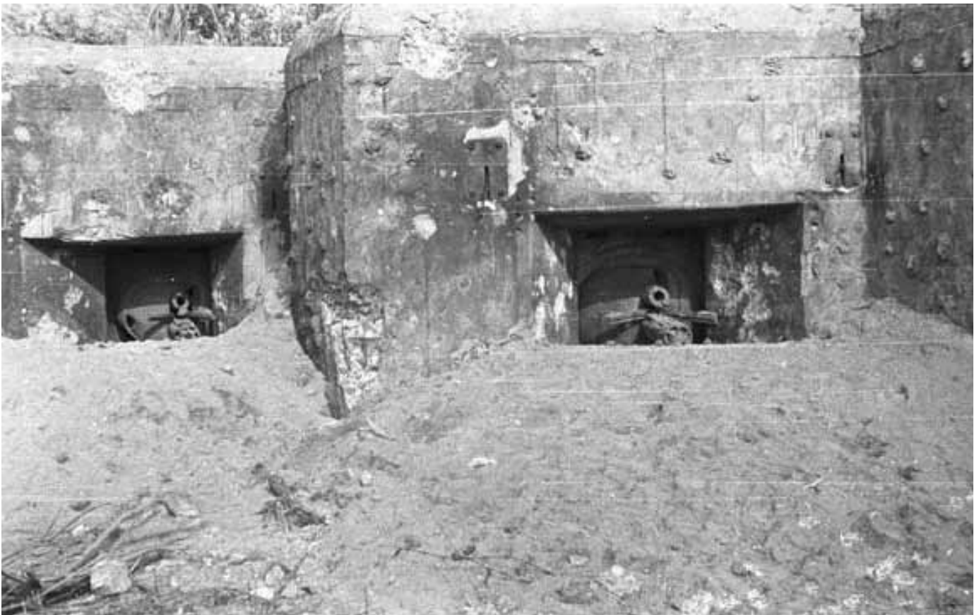
מצדית בקו סטלין חמושה בתותחים נגד טנקים (צולמה על ידי הגרמנים לאחר שכבשו אותה) | קו סטלין הוא הכינוי המקובל למערכת הביצורים שכנו הסובייטים בגבולם הישן עם פולין