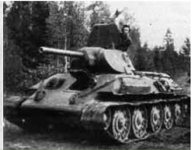
מימין: T-34 דגם B משמאל: KW-1 דגם B | 1,861 טנקים מהדגמים המתקדמים האלה עמדו לרשות הצבא האדום ביוני 1941

נאלצו הסובייטים להעביר להם את רוב משאיותיהן של דיוויזיות הרגלים. 37 הם אומנם תיכננו להשלים לפחות חלק מהחוסרים באמצעות גיוס כלי רכב אזרחיים, אך הגיוס הזה החל רק אחרי פרוץ המלחמה, כך שרוב היחידות בחזית לא קיבלו את ההשלמות שנזקקו להן לפני שהותקפו על ידי הגרמנים.