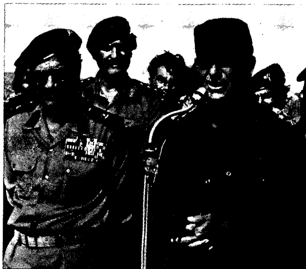
חאפז אסד, נשיא סוריה ומפקד צבאה.

החלטת הנוצרים על עימות מזוין כנגד הסורים על אף מערכת זו של דו-קיום בשלום היו הסורים והנוצרים כאחד מודעים היטב לאפשרות כי הניגודים העמוקים שביניהם עלולים להבישיל לידי עימות חריף, לכשתיווצר הקונסטלציה המתאימה (כאשר לכך נוסף גם חששם של הנוצרים מפני הת-לקחות מחודשת של העימות כנגד השמאל והפלסטינים). על רקע זה ניתן היה להבחין במהלך שנת 1977 בהתכוננות צבאית בקרב המחנה הנוצרי אשר בהדרגה הלך וגבר אצלו החשש מפני מגמותיה של סוריה לטווח הארוך יותר. כשם שהעימות בין סוריה לפלסטינים עמד ביסוד הקואליציה הסורית-נוצרית,