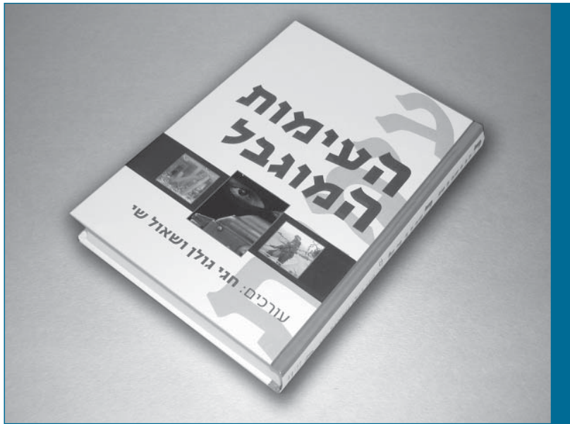
לקט מאמרים שעניינם העימות המוגבל שיצא לאור בהוצאת "מערכות" ב-2004

המוגבל", שאותו כתב אלי"ם שמואל ניר (סמו) ז"ל. מחלקת תוה"ד הפיצה את הספר הזה ב-2001 לאחר שקבעה כי מדובר ב"עקד" - ספר תו"ל מחייב ברמת המטה הכללי. בספר הזה מוצגים המושג "העימות המוגבל", רקעו, מיקומו בקשת העימותים וטבעו. הספר אינו מציג תורת לחימה, אלא סקירה היסטורית. כשסמו כתב את הספר הוא לא היה איש תוה"ד, אלא כותב חיצוני, שכתב בעבור מחלקת תו"ל שבחטיבת תוה"ד. הספר לא תוכנן להיות "עקד" - ספר תו"ל מחייב - אלא חומר העשרה, ורק בטעות נקבע שמדובר ב"עקד". באותה מידה שגויה ההודעה בפתחת הספר שמדובר בפרסום שמחייב את צה"ל בהתאם להוראות הפיקוד העליון 1.0105. 2 ואכן בסוף הספר מציין המחבר כי מדובר בסיכום תובנות ולא באורים ותומים. וכך אכן יש להתייחס אליו.