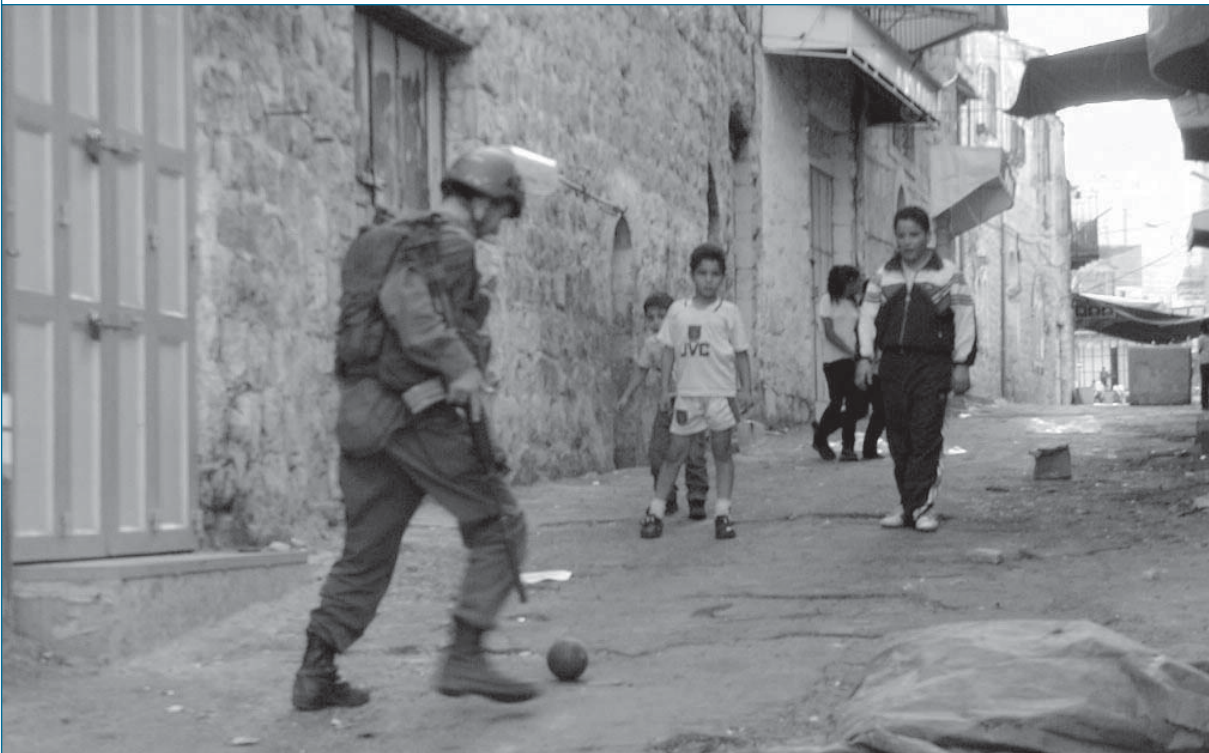
הלמידה לאורך תקופת הלחימה ב“גאות ושפל” הייתה בעיקר חילית ולא זרועית

ביחידות השונות אין הפריה הדדית וניהול של הידע. ניתן לומר שהידע מתנהל אך אינו מנוהל. הידע והלקחים הקיימים ביחידות מועברים על בסיס היכרות אישית, ללא נוהלי עבודה מסודרים. 36