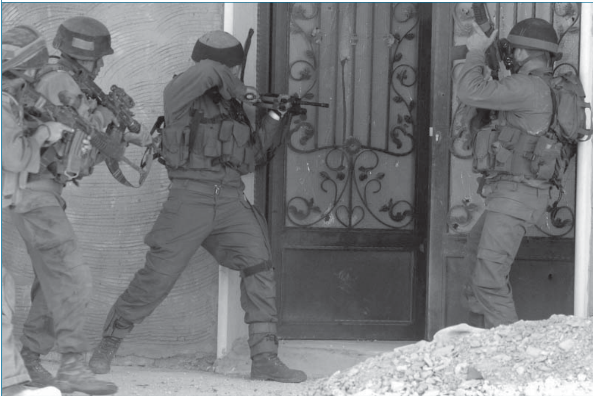
תורת הלחימה בשטח בנוי פורסמה והפכה למסמך תורתי מחייב רק ב־2004