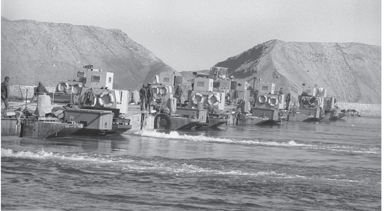
בניית גשר הדוברות בתעלת סואץ. הצורך בארגון "החצר" למתחם רב תפקודי ניכר עם הגעת הדוברות בבוקר 17 באוקטובר והתחלת בניית הגשר.

ארגון השטח. התמקמות כוחות הסיוע הקרבי והסיוע המנהלתי במתחם התבצעה בצורה מאולתרת, עם הגעתם אל שטח "החצר". ניתוח תרשים המתחם מעלה כמה שגיאות באופן פריסת הכוחות וארגון המרחב (ראו: תרשים 2). במתחם עורפי דוגמת במ"ק יש להקפיד על עקרונות אלה: