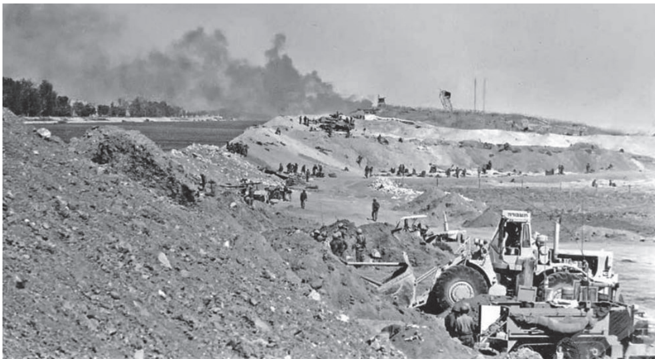
מתחם "החצר" בהיערכות לחציית התעלה. בתוך "החצר" החלו בתחילה להתקבץ יחידות לוחמים שונות ויחידות ייעודיות למשימות אבטחה, להשקת סירות הגומי ולצליחה מערבה.

במהלך כל ימי הקרבות, מחציית התעלה ועד הפסקת האש, המשיכו אנשי "החצר" לפעול בנחישות. על אף הכאוס וחוסר האורגניות במבט של 50 שנה לאחור, עמדו המפקדים והחיילים במתחם במבחן האש, המנהיגות והחוסן. לא ניתן להתעלם מהדמיון הרב בין מתחם "החצר" למגננים והבמ"קים (בסיסי המבצעים הקדמיים) הקיימים בתפיסות ההפעלה בימינו