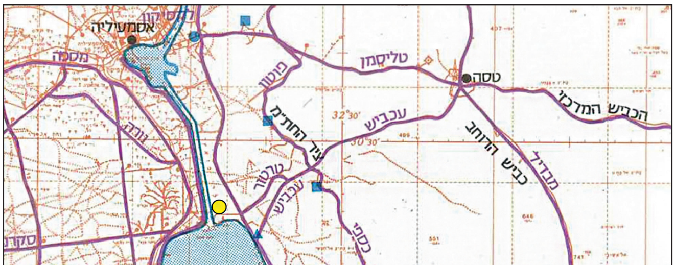
תרשים 2: מרחב מתחם "החצר" על גבי מפת קוד "סיריוס". מתוך: אטלס מלחמת יום הכיפורים מאת מחלקת היסטוריה בצה"ל, מפה 5 - זירת התעלה

בשלב זה לא הייתה באזור תעסוקה רבה, שכן התנועה ממזרח פסקה בעקבות פקקים בצירים. המצב השתנה כאשר מהצד