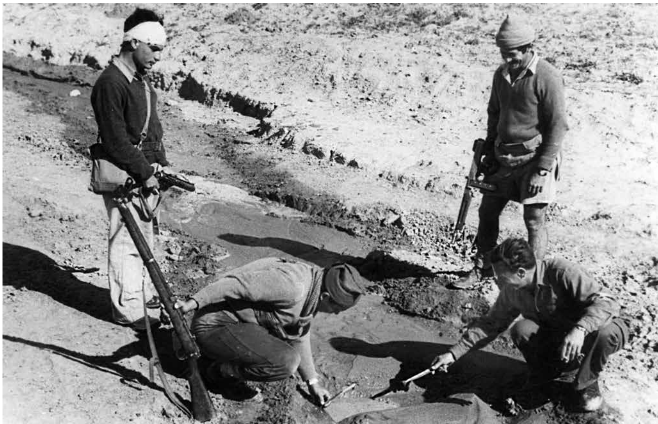
בדיקת חבלה בצינור המים ליישובי הנגב המבודדים, ליד קיבוץ בארי, 1948. במהלך מלחמת העצמאות השתתפו כמה מהיישובים בלחימה באופן פעיל. חלקם הגנו בגופם, עם כוחות אחרים, ומנעו או עיכבו את התקדמות כוחות האויב דרכם או בסמוך להם.

נותר כמעט ללא שינוי (למעט השינוי בסיווגם כקדמיים ועורפיים), הוקם "חבל" כמפקדת שליטה בחירום והגוש היה, למעשה, היחידה הטקטית הגבוהה ביותר במערך, מלבד מפקדת ההגמ"ר בפיקוד המרחבי.