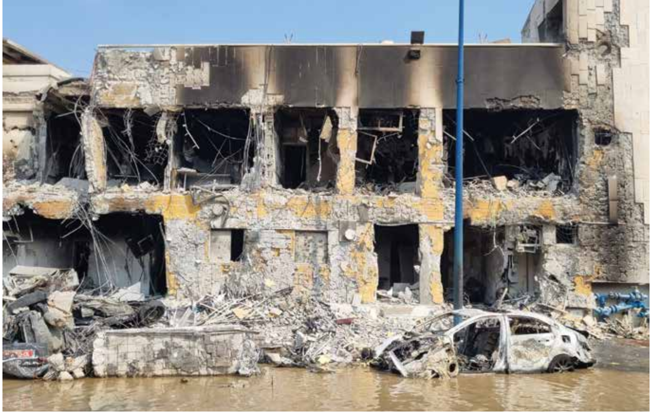
שרידי תחנת המשטרה בשדרות בסימו של הקרב נגד מחבלי החמאס. פעולה זו ממחישה את אופיו של האיום על הגבולות של ישראל, אשר נראה כי צה"ל לא נערך אליו במידה הדרושה, לפחות בכל הקשור למצבת הכוחות בגבולות

לאפשר שימוש יעיל בכלי זה, תוך השארתו ברמה הטקטית והוצאתו מכללי המשחק האסטרטגי. נראה כי לאחר הפינוי שנערך בגבול הצפון במלחמת "חרבות ברזל", וזה שנעשה בדרום לאחר 7 באוקטובר, הציבור הישראלי הוכשר לכך.