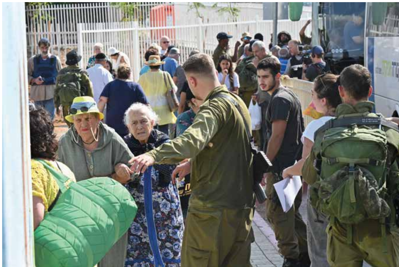
תושבים מפונים משרדות. פריצתה של מלחמת "חרבות ברזל" ממחישה את הצורך לדון מחדש בתפיסת ההגנה המרחבית כפי שהייתה בשנים הראשונות של מדינת ישראל.

רעיון פינוי היישובים אינו חדש. הדיון בו מתקיים בישראל ממלחמת העצמאות ומתממש בגבול הצפון במהלך מלחמת "חרבות ברזל". לפינוי יישובים השפעה מורלית על האוכלוסייה והמנהיגים, אך הכנה מתאימה של המנהיגים והציבור לכך יכולה לאפשר שימוש יעיל בכלי זה, תוך השארתו ברמה הטקטית והוצאתו מכללי המשחק האסטרטגי