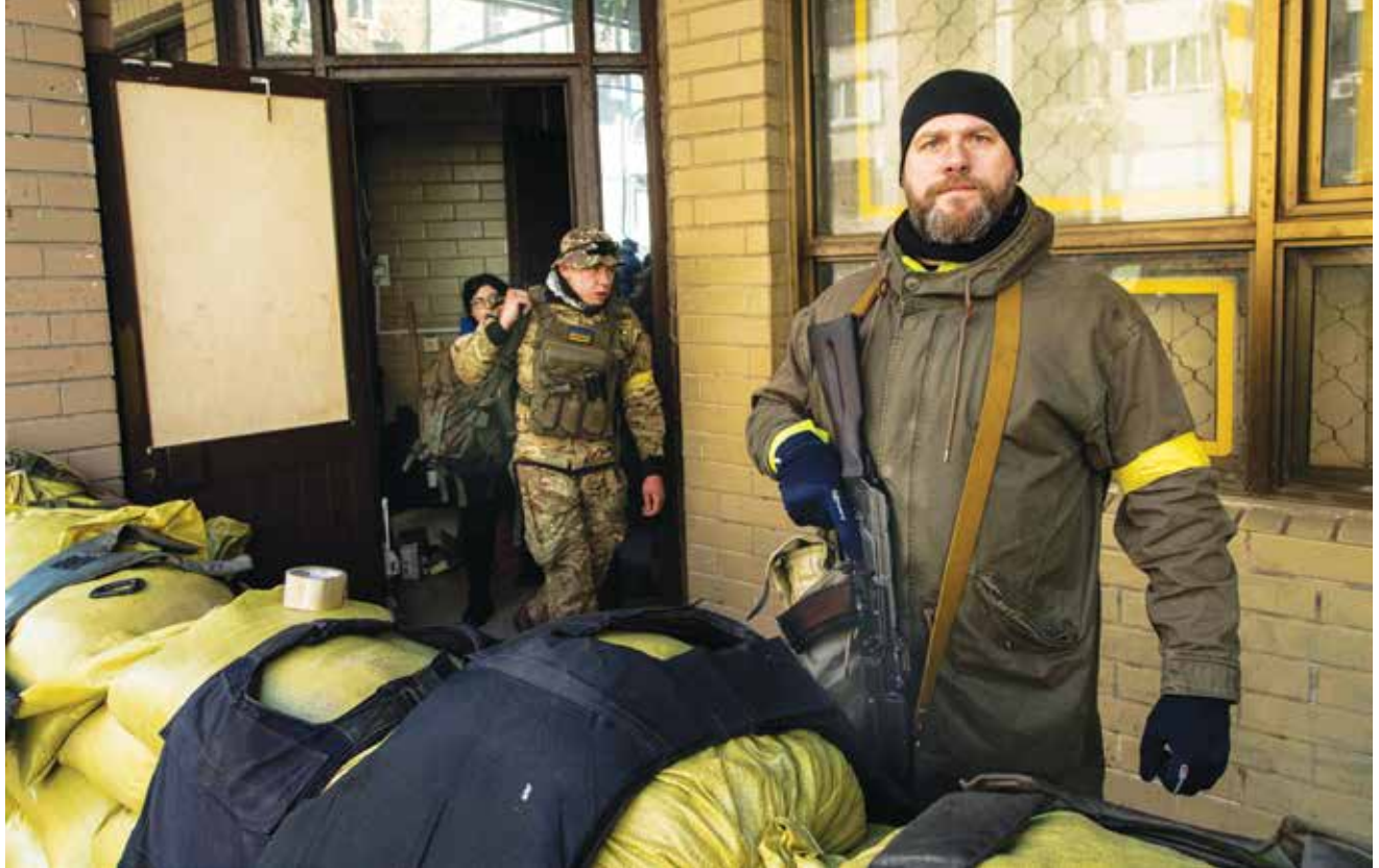
אזרחים בקייב, מתחמשים לקרב. הסרט הצהוב בזרוע השמאלית מסמן את חברי כוחות ההגנה הטריטוריאליים (אוקראינה). יחידות הגנה מרחבית אלה הוקמו גם בתוך הערים הגדולות כמו קייב, ולמעשה אומנו להילחם גם בשיטות של גרילה נגד כוחות צבא פולשים.

ההתרעה. אלה, כידוע, קרסו גם בפרוץ מלחמת יום הכיפורים שהחלה 50 שנים ויום לפני "חרבות ברזל".